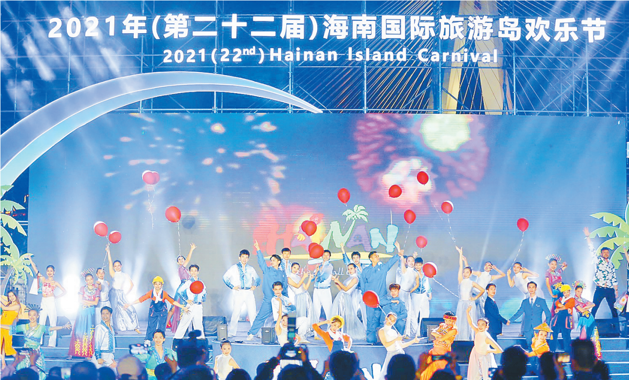
12月10日，2021年（第二十二届）海南国际旅游岛欢乐节在海口世纪公园正式开幕。（更多报道见A03版）

省领导肖莺子、康耀红、王路，中国—东盟中心教育文化旅游部副主任李亚莹、柬埔寨王国驻海口总领馆总领事黄万达等出席开幕式。