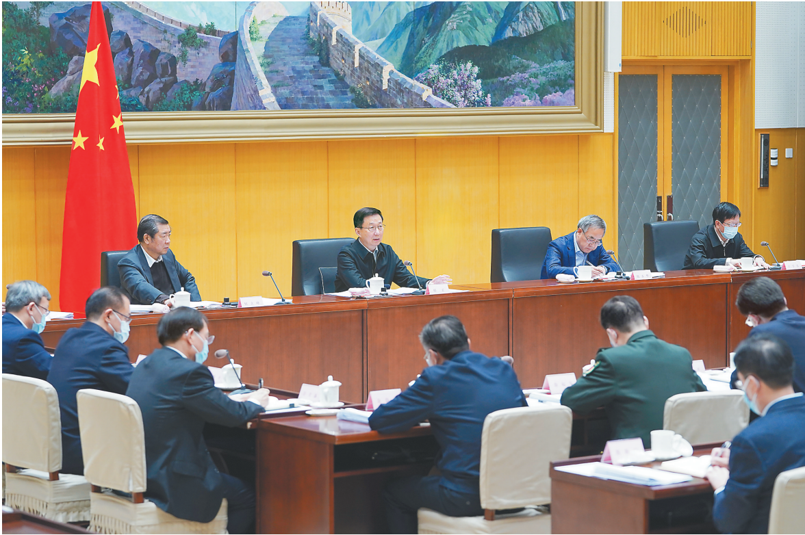
十二月十日，中共中央政治局常委、国务院副总理、推进海南全面深化改革开放领导小组组长韩正在北京主持召开推进海南全面深化改革开放领导小组全体会议。

新华社北京12月11日电 中共中央政治局常委、国务院副总理、推进海南全面深化改革开放领导小组组长韩正10日主持召开推进海南全面深化改革开放领导小组全体会议，认真学习贯彻党的十九届六中全会和中央经济工作会议精神，总结2021年推进海南全面深化改革开放工作，审议有关文件，研究部署2022年重点工作。 韩正指出，《海南自由贸易港建设总体方案》发布实施以来，各有关方面深入贯彻落实习近平总书记重要指示精神，早期政策逐步落地见效，重大功