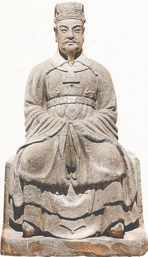
陈抟雕塑。