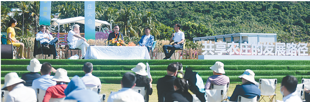
12月14日至15日，2021年共享农庄大会在三亚大茅共享农庄举行。

坚持维护品牌。坚持树立及维护共享农庄品牌形象，提高共享农庄建设水平。加强宣传培训，推动正确理解、掌握共享农庄理念和相关政策。