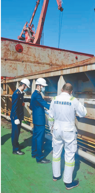
洋浦海事局工作人员在码头检查货舱。

截至11月30日，今年洋浦海事局共安全保障船舶进出港18878艘次，同比增加14.54%；集装箱吞吐量123.1万标箱，同比增加36.52%；货物吞吐量5104.06万吨，其中危险品吞吐量3413.89万吨，占全省的68%。辖区共发生水上交通事故6起，均为一般等级及以下事故，全年水上交通安全形势保持总体平稳，为洋浦航运产业高质量发展提供了坚强保障。