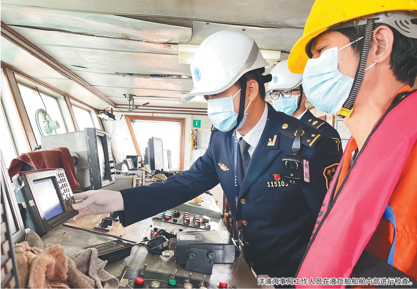
洋浦海事局工作人员在液货船舶舱内部进行检查。