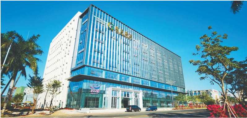
陆侨国际海产品产业园项目计划明年3月开业。

园项目符合洋浦保税港区产业发展布局方向，具有较高的显示度和创新性。项目通过国际采购海产品干货和冻品，在洋浦保税港区经加工增值30%后，免关税销往内地，充分利用海南自贸港加工增值政策。该产业园通