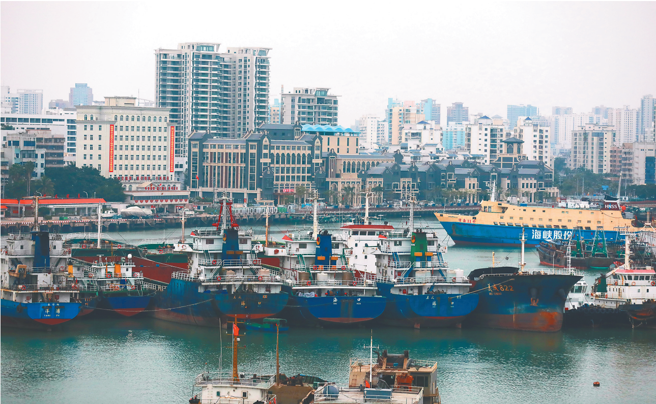
12月19日,为防范今年第22号台风“雷伊”,大量船只停泊在海口市海甸溪避风。

岛东半部地区将有较强风雨。省气象部门提醒:台风“雷伊”将给南沙诸岛带来强风雨,预计其还将严重影响西沙、中沙群岛附近海域,请在南海中部、南部诸岛上人员继续留在安全室内,在港渔船继续做好安全管理工作;因受南下冷空气影响,台风“雷伊”后期强度、路径变化仍存在一定不确定性,省气象局将继续加强监测预报,及时滚动发布最新信息。