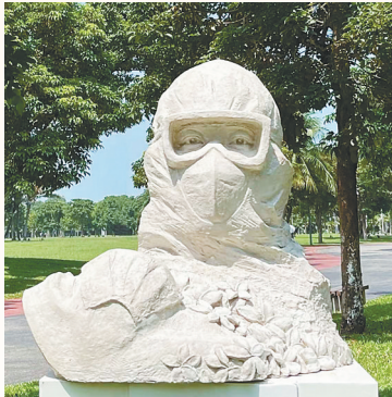
陈学博雕塑作品《前赴后继》。