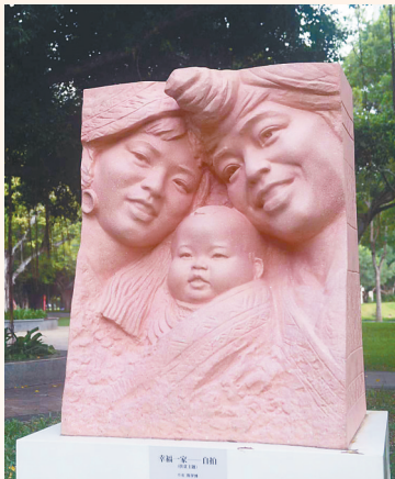
陈学博雕塑作品《幸福一家——自拍》。