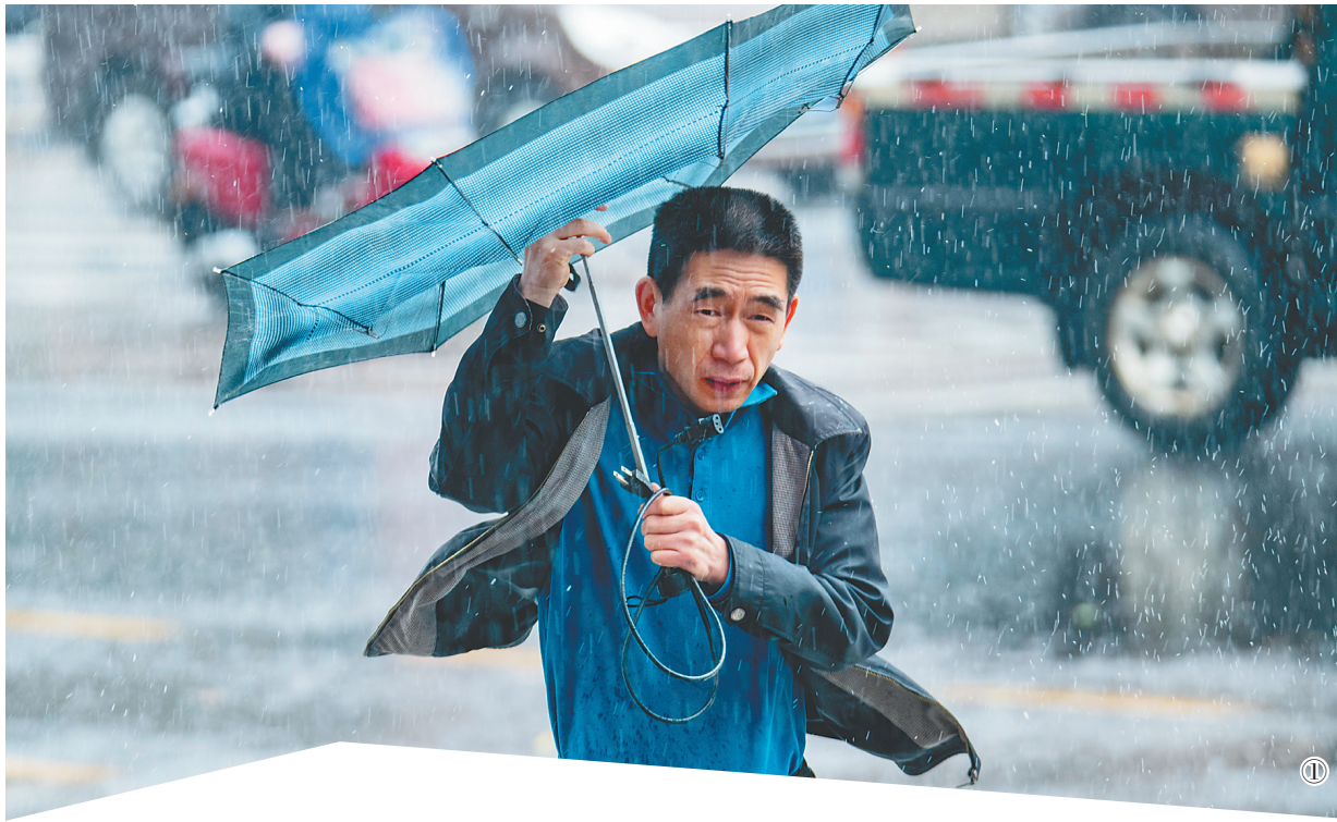
①②12月20日，琼海市市民在风雨中出行。

12月20日14时，台风“雷伊”逐步远离三沙海域，西沙群岛解除台风橙色预警。三沙有关部门负责人介绍，三沙市对台风“雷伊”防御准备工作做得早、做得充分，确保了群众生命财产安全和正常生产生活秩序。12月21日，驻岛干部职工将恢复生产工作，进入正常生活状态。