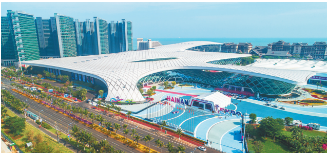
首届中国国际消费品博览会今年5月在海南国际会展中心成功举办。

作为cdf海口日月广场免税店销售部的一名主管，我目前负责店内10个品牌的香化产品销售，今年以来，我最大的感受就是离岛免税越来越火：今年，cdf海口日月广场免税店有多个品牌入驻，多重优惠购物让利活动不断推出，顾客选择越来越多，尤其在节假日，进店消费的客流量很大。在免税店内，我们遇到越来越多来自不同省份甚至不同国家的游客，他们会带着去往不同城市的航班信息或轮渡信息进店选购免税商品，我们也尽最大努力为他们提供舒心的免税购物体验，让大家在海南自贸港“购”得开心。（本报记者 周晓梦 整理）