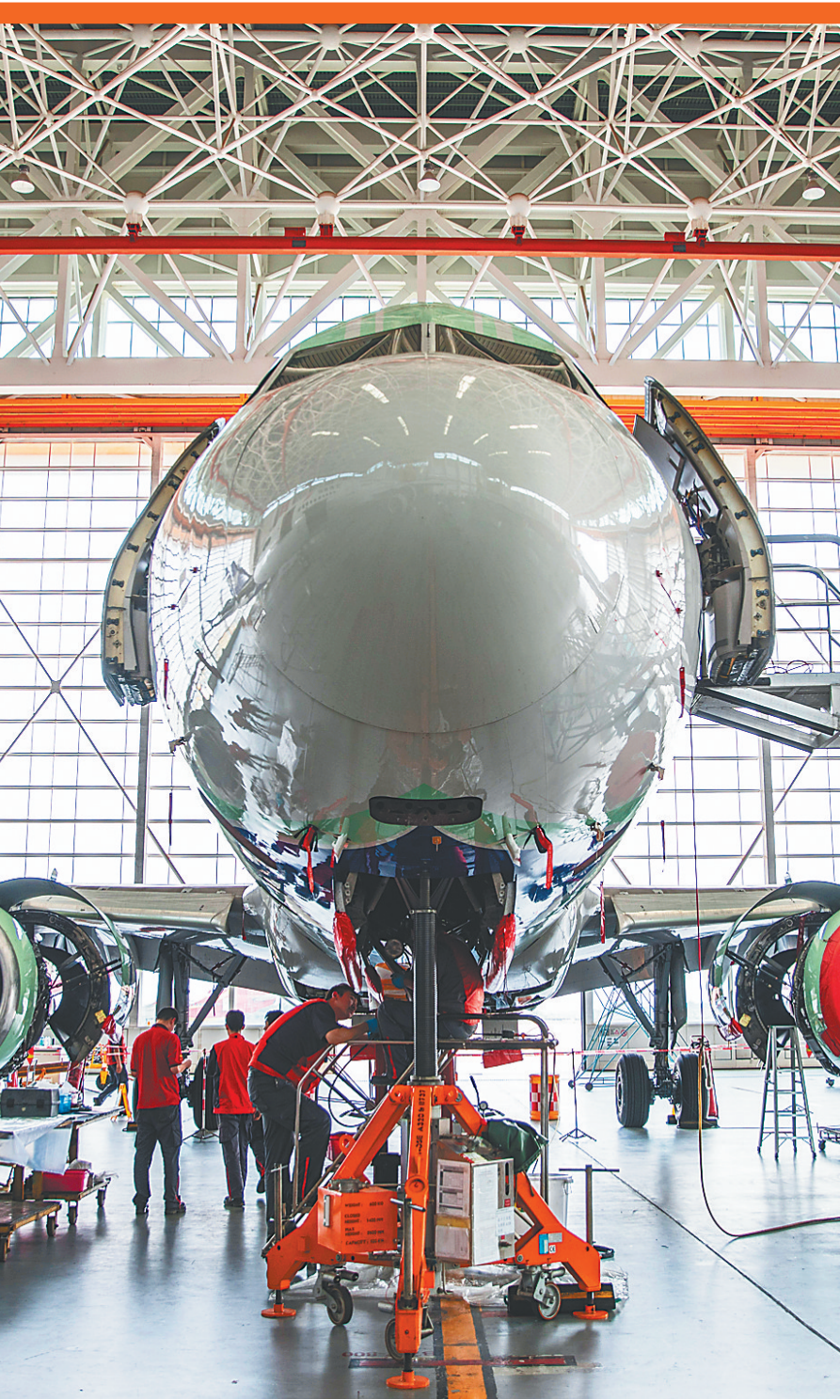
在位于海口江东新区的海航航空技术有限公司海口1号机库工作人员在维修飞机

观全国，自贸区雁阵齐飞、搏击万里长空；看海南，自贸港巨轮劈波斩浪、蹄疾步稳推进。来之不易、格外珍贵的成绩背后，彰显了海南深入学习贯彻习近平总书记系列重要讲话和指示批示精神，坚持“闯”为基调、“稳”为基础、远近结合、小步快跑，分步骤分阶段推进自由贸易港建设，加快推动各项政策特别是关键核心政策落地实施，初步形成具备全球竞争力的开放政策和制度体系，各项政策对海南经济社会发展的推动作用已经显现。