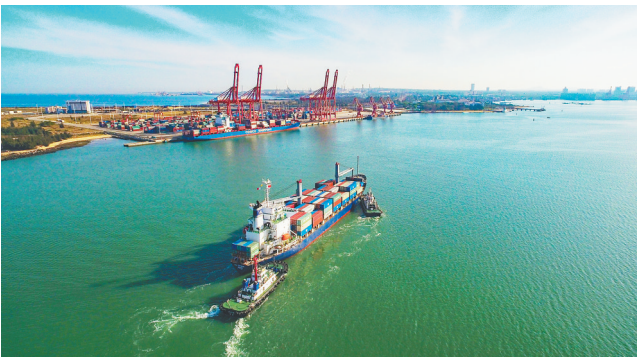
在洋浦经济开发区小铲滩码头，一艘满载集装箱的轮船缓缓驶进港口，码头一派繁忙的景象。