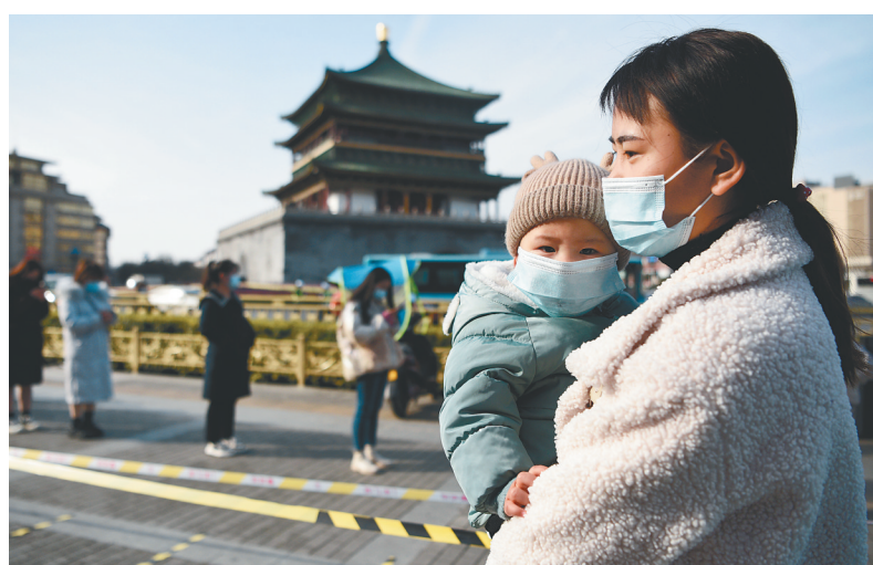
在西安市钟楼附近的核酸检测点，一位妈妈抱着宝宝排队等待核酸检测。

出行前，如出现发热、咳嗽等呼吸道症状，应暂时中止出行计划，避免旅途劳累症状加重，并及时就医，待康复后再安排出行。旅途中做好个人防护，遵守目的地疫情防控规定。