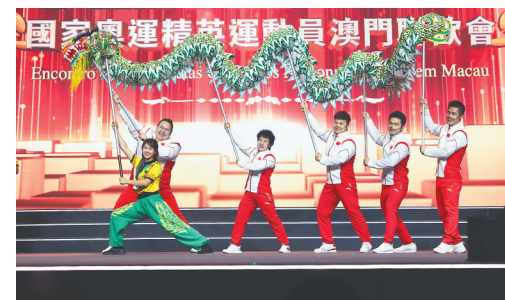
12月20日，内地奥运健儿代表团在澳门东亚运动会体育馆参加“我们的骄傲——国家奥运精英运动员澳门联欢会”活动，与澳门市民互动交流。图为内地奥运健儿代表团成员李雯雯、侯志慧、汪周雨、石智勇、吕小军（后排从左至右）在活动中进行舞龙表演。