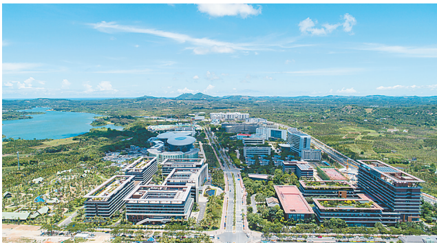
俯瞰海南博鳌乐城国际医疗旅游先行区。