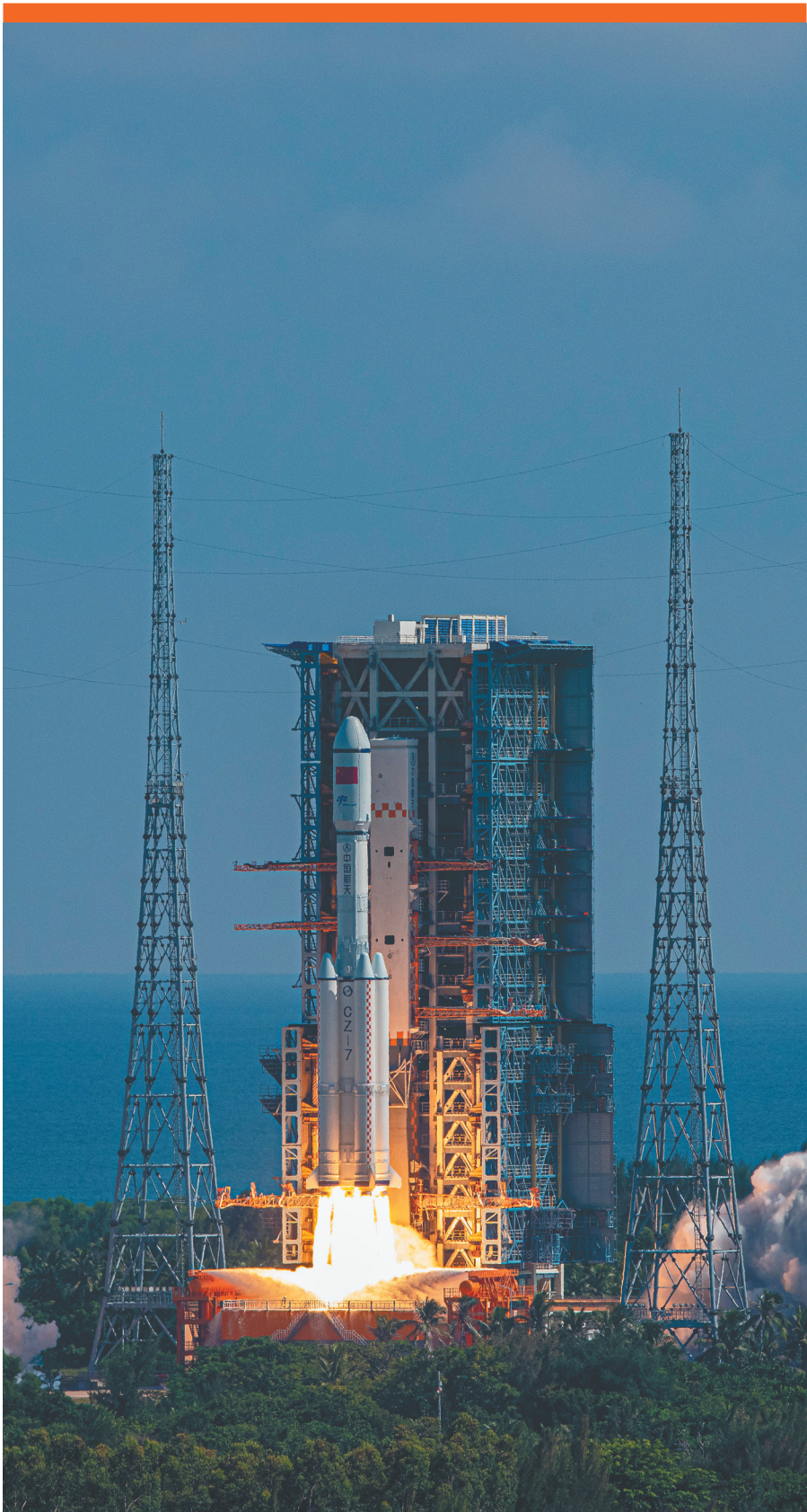
长征七号遥四运载火箭在文昌航天发射场成功发射，将天舟三号货运飞船准确送入预定轨道。

一年来，海南高质量发展步伐越来越坚定，各类市场主体踊跃响应，生态环境持续改善，营商环境日益优化，现代产业格局正在形成，人民群众获得感稳步增强。