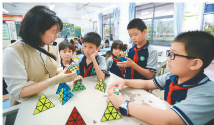
海口市玉沙实验学校学生正在参加特色校本课程。