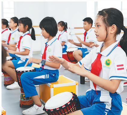
海口市英才小学滨江分校学生正在上非洲手鼓课。