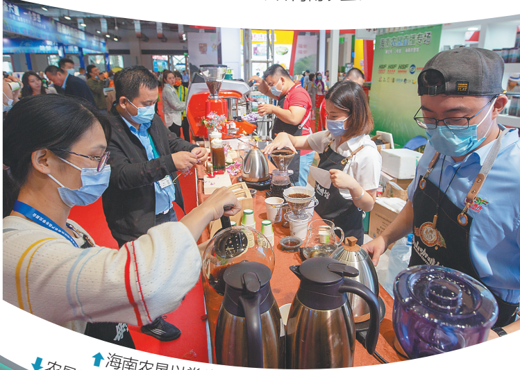
海南农垦以拳头产品和重点产业抢抓客商眼球。农垦馆内的名优农副产品。