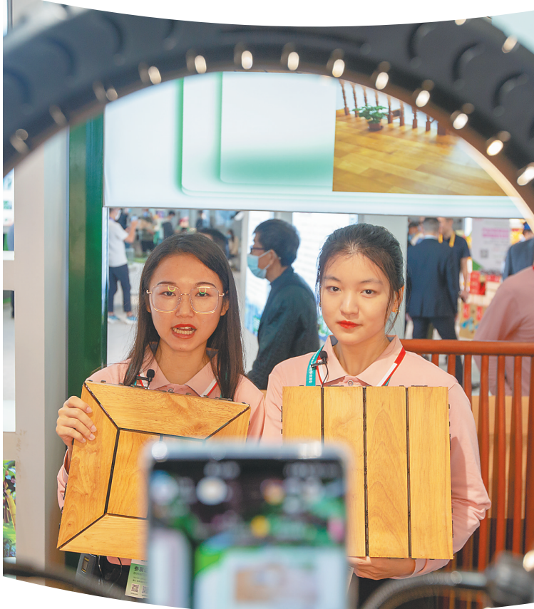
主播利用直播带货平台推介海南农垦特色产品。