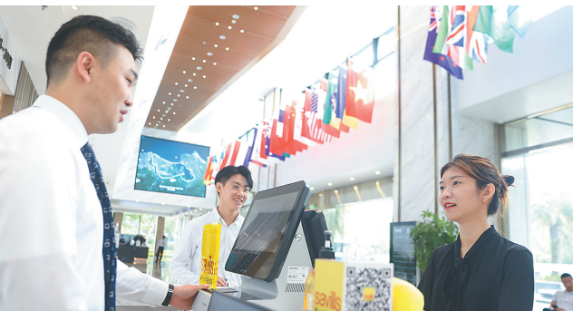
在位于海口国兴大道的全球贸易之窗写字楼，工作人员为入驻企业提供一站式商务服务。