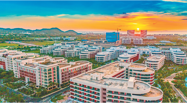
三亚崖州湾科技城管理局租赁雅布伦科技产业园已建成楼宇，为企业、科研机构入驻提供保障。