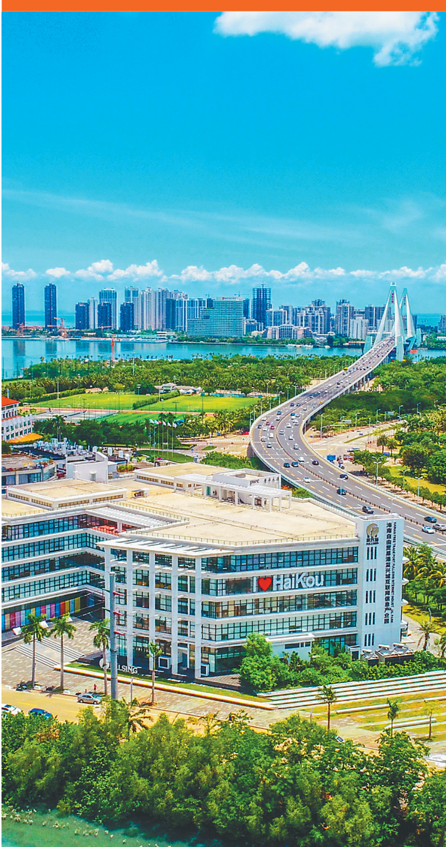
远眺海口复兴城互联网信息产业园。

面对海南自由贸易港建设这一千载难逢的历史机遇，各类市场主体踊跃响应，组成海南自贸港建设“主力军”，为高质量高标准推进自贸港建设提供强劲动力与源源活力。