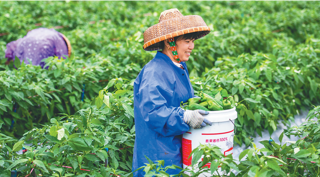
琼海辣椒抢“新”上市

亩。按用途划分，防护林905.55万亩、特种用途林377.87万亩、用材林587.99万亩、经济林1425.03万亩。 下一步，海南将科学编制林地保护利用规划，优化林地保护利用空间布局，科学编制林地保护利用规划，高质量落实全省林地保有量任务。 省自然资源和规划厅相关负责人表示，海南将全面推行林长制，完善林长制相关配套制度建设。设立林长制考核指标，将森林覆盖率、森林蓄积量、生态公益林面积、天然林面积等作为考核重要指标，明确年度计划任务。