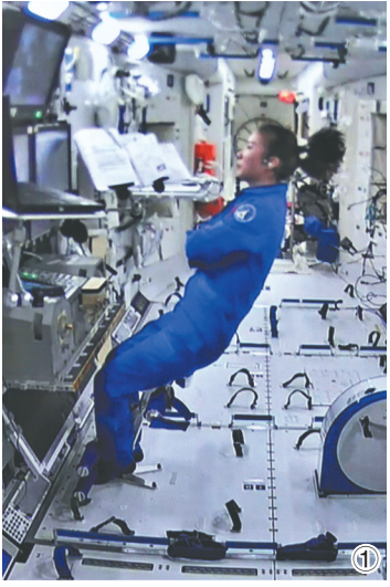
①神舟十三号航天员王亚平在核心舱内工作场景。 ②神舟十三号航天员叶光富出舱画面。 ③神舟十三号航天员翟志刚出舱画面。

新华社北京12月26日电（记者王逸涛 郭中正）据中国载人航天工程办公室消息，北京时间2021年12月26日18时44分，神舟十三号航天员叶光富成功打开天和核心舱节点舱舱门，航天员叶光富于18时50分、航天员翟志刚于19时37分，身着我国新一代“飞天”舱外航天服，先后从天和核心舱节点舱成功出舱，后续将协同开展空间站舱外全景相机C抬升、自主携物转移验证等操作。其间，驻守舱内的航天员王亚平配合地面操控机械臂，支持两名出舱航天员开展舱外作业。 据了解，实施舱外作业正在成为空间站阶段飞行任务工作常态。后续，中国航天员将开展次数更多、更为复杂的出舱活动，为空间站顺利完成建造及稳定运营提供有力支持。