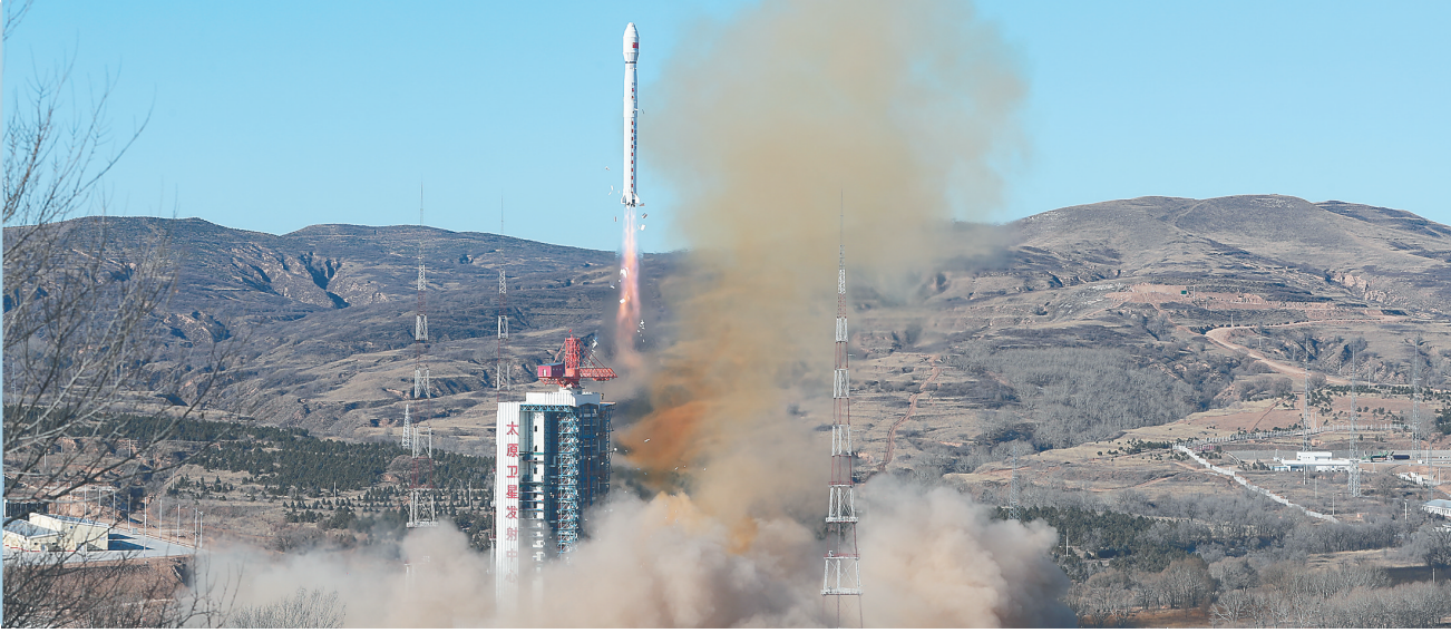
图为发射现场。