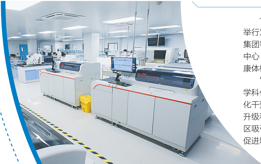
↑↓博鳌一龄生命健康预检中心引进的迪瑞标准化实验室。