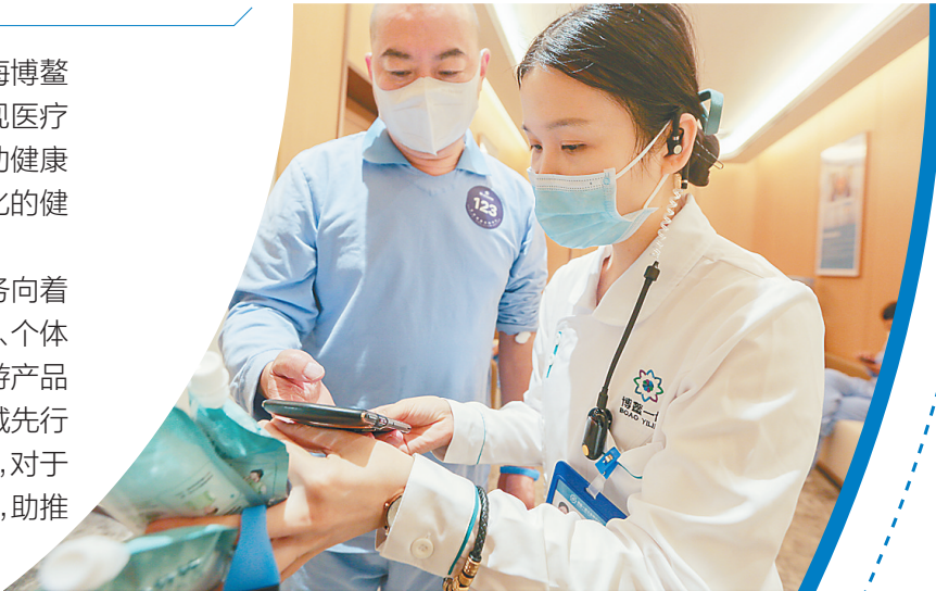
↑↓博鳌一龄生命健康预检中心工作人员为体检者提供贴心服务。