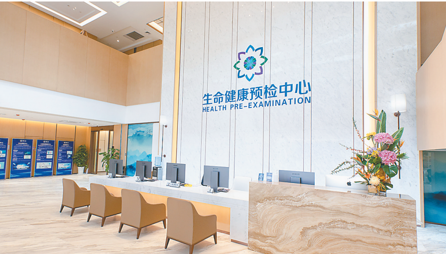
博鳌一龄生命健康预检中心前台。