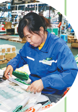
12月29日,在海南创佳达生物科技有限公司生产车间,工人打包全生物降解购物袋。