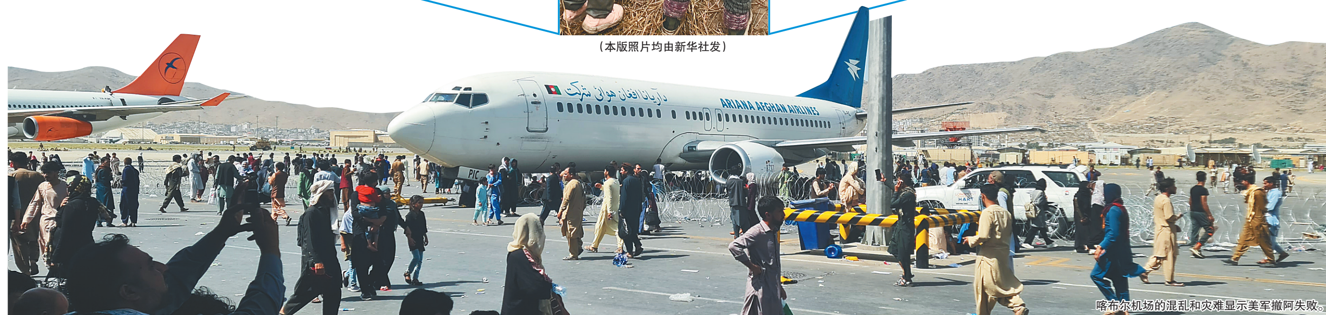
喀布尔机场的混乱和灾难显示美军撤阿失败。