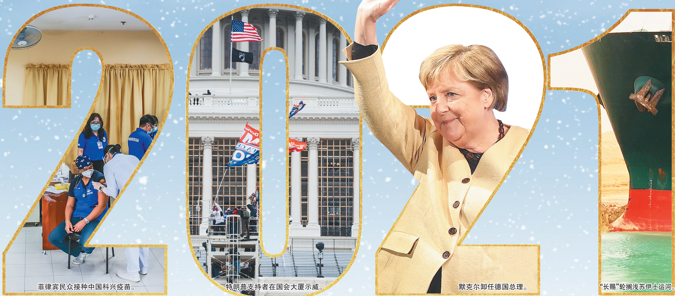
菲律宾民众接种中国科兴疫苗。