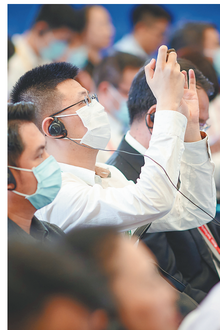
博鳌亚洲论坛2021年年会全球自由贸易港发展趋势分论坛上,现场嘉宾认真聆听内容分享。