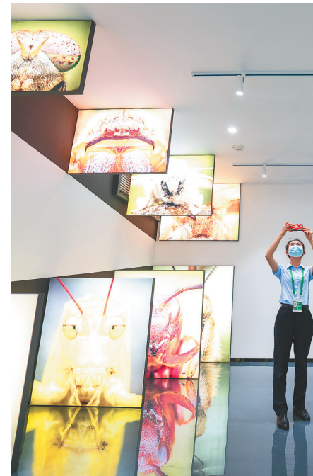
4月20日,博鳌亚洲论坛主题公园画苑内,观众在参观拍摄画苑内展出的精美摄影作品。