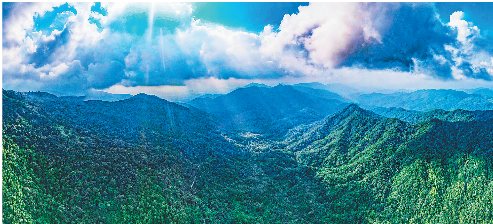
海南热带雨林国家公园霸王岭片区。