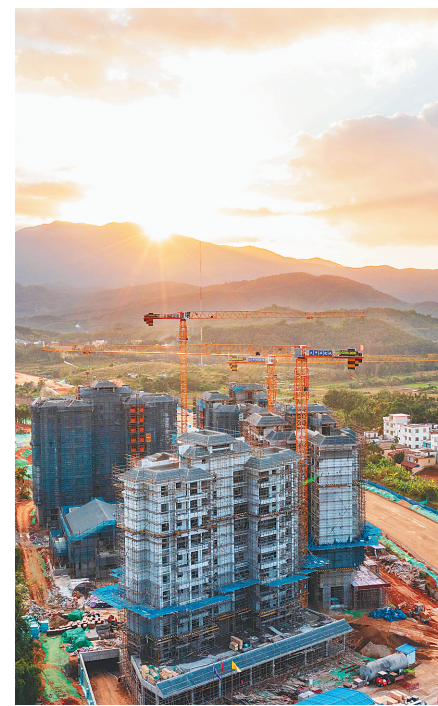
俯瞰五指山市生态搬迁安置工程项目,该项目目前正在抓紧施工。