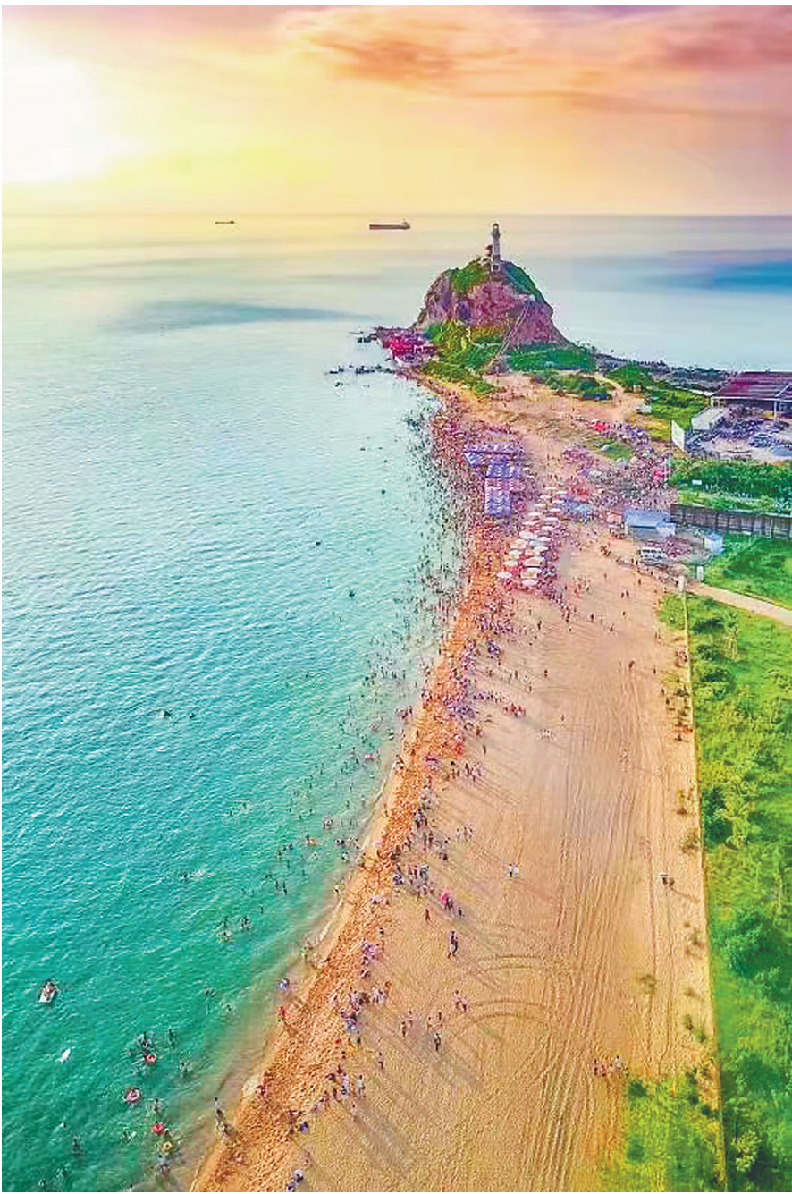
航拍东方市鱼鳞洲。