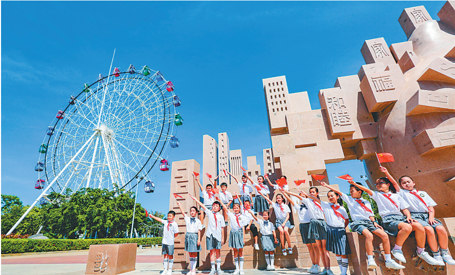
在东方市海东方公园,一些小学生利用周末录制视频。