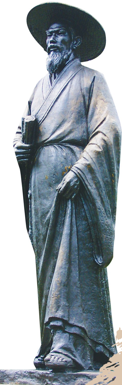
儋州市中和镇东坡书院苏东坡塑像。