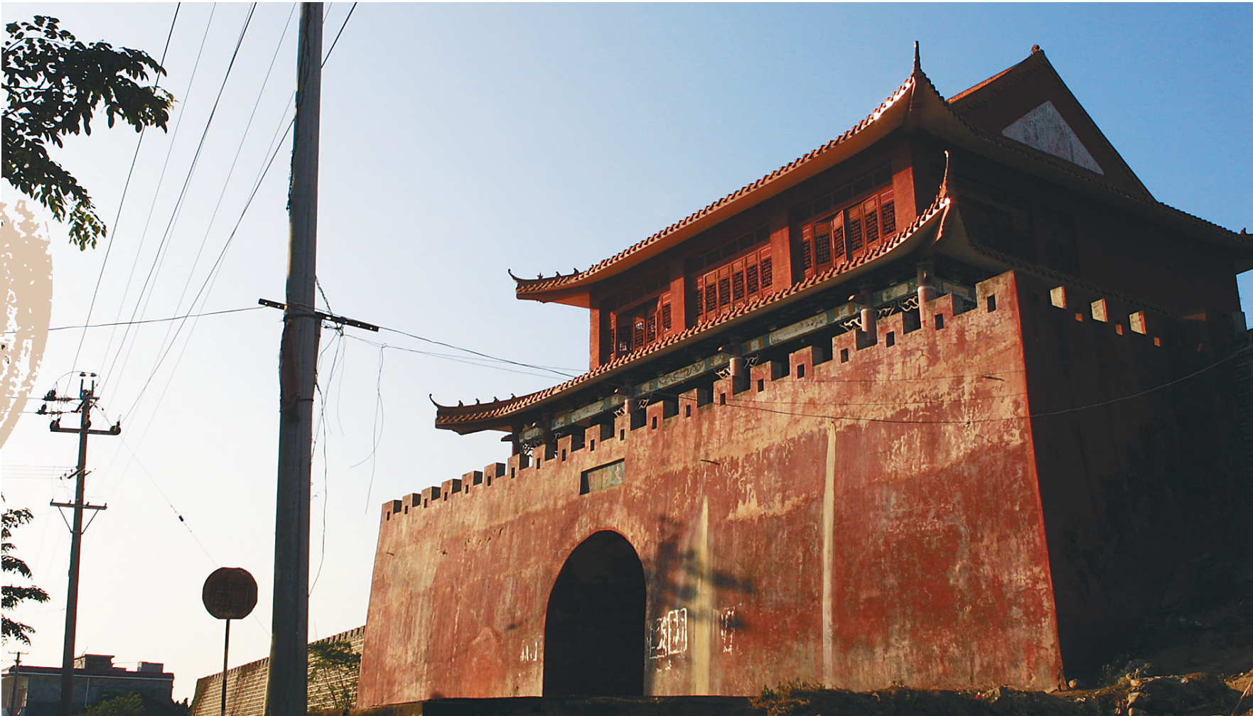
三亚市崖城镇是历史悠久的千年古城。

相对而言，万安州在历史上存在时间较短。唐贞观五年(631年)设立万安县，隶属琼州管辖。龙朔二年(662年)，万安县改为万安州。南宋绍兴七年(1137年)，万安州更名为万宁县，这是历史上第一次出现万宁县的名称。绍兴十三年(1143年)，万宁县更名为万安军。明清时期，万安军更名为万州。民国后，万州一直被称为万宁县。1996年，万宁撤县设市。