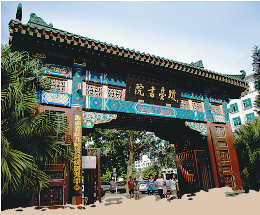
海口市琼台书院。