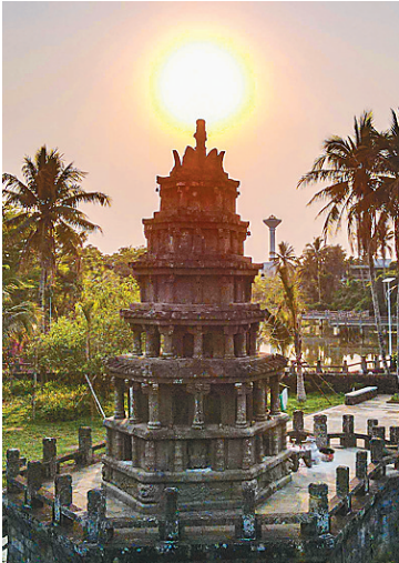
在澄迈县金江镇美榔村，姐妹塔屹立在落日余晖下。

海南东部的陵水黎族自治县自从隋大业六年(610年)设立之后，一直沿用至今。陵水境内有陵水河直通大海，县以水名。乐东、屯昌、保亭之名的使用，大致是明清时期的事了。明朝时，崖州曾在抱由峒南侧建筑“乐安城”，此后又有乐安营等。1935年，广东省政府设立乐安县，随后更名为乐东县，名称沿用至今。明清之交，不少百姓逃荒到海南，屯荒垦殖以图昌兴，因此有“屯昌”之名。屯昌之名虽然有几百年历史，但设县时间很短，源于1948年设立的新民县，因和辽宁一县同名，因此于1952年更名为屯昌县。清政府曾经在五指山南麓设立“宝亭营”，后来被演化成保亭(也有说法是为了纪念清末名将冯子材驻军建立凉亭，即“冯官保亭”，简称“保亭”)。1935年正式设立保亭县，县名沿用至今。