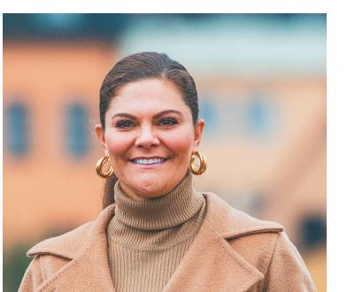
瑞典女王维多利亞。

自新冠疫情暴发以来,瑞典一直采取较为宽松的抗疫政策,近期新增确诊病例激增。据瑞典公共卫生局公布的统计数据,该国5日新增新冠确诊病例23877例,创疫情暴发以来单日新增病例最高纪录。目前,瑞典累计确诊病例近142万例,累计死亡病例15377例。