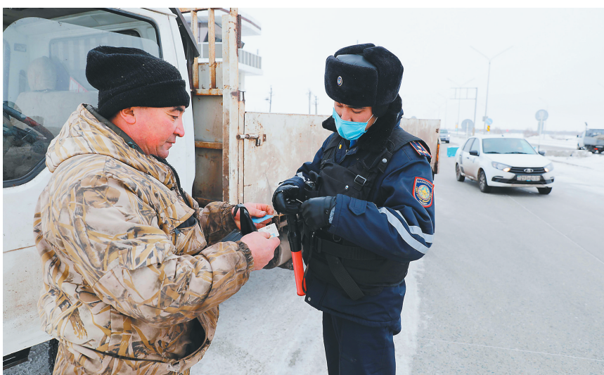
哈萨克斯坦执法人员在努尔苏丹的进出城检查站进行巡查。

9日,哈首任总统纳扎尔巴耶夫的新闻秘书阿伊多斯·乌克拜在一份致媒体的声明中说,把国家安全委员会主席一职移交给现任总统托卡耶夫的决定是由纳扎尔巴耶夫夫人作出的。纳扎