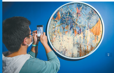
市民对《海岛3号》(布面油画)充满兴趣。

在展览开幕式上,省文联作协党组书记、省文联主席夏斐对来琼的艺术家表示欢迎,并发出邀请。他表示,海南自贸港和艺术是相互成就的,一方面,艺术会赋予海南自贸港更多魅力,另一方面,海南自贸港是一个火热的舞台,艺术将会在这个舞台上大放光彩。■