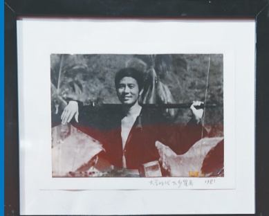
陈海的摄影作品。