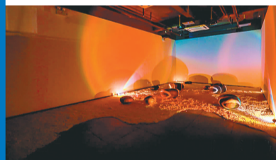
艺术家心中的意境之海。