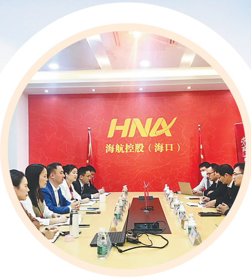
辽宁方大集团下属企业与海南航空党员员工开展党建文化交流活动。