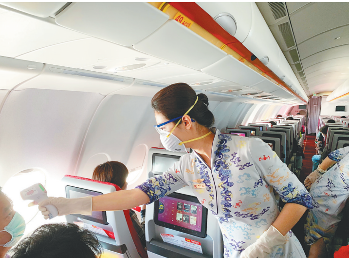
海南航空严格落实疫情防控常态化措施。