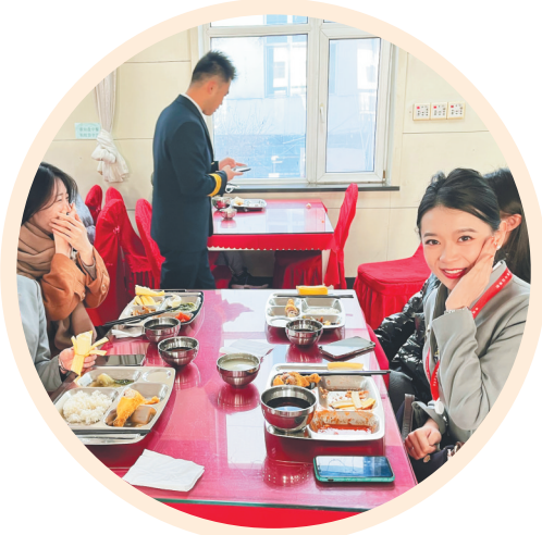
海南航空太原基地员工吃上“免费工作餐”。

2021年12月8日，是海航航空集团发展进程中具有重要意义的一天。当天，海航航空集团经营管理实际控制权正式移交，标志着该集团正式加入辽宁方大集团。在新的历史起点，海航航空集团开启新征程，实现新发展。 一个月以来，海航航空集团旗下海南航空控股股份有限公司（以下简称海南航空）快速融入方大企业文化，坚持党建引领企业发展，积极践行“党建为魂”的企业文化，遵循“四个有利”的企业价值观，统一意志、统一行动、团结一心“变、干、实”，围绕贯彻落实党建引领，狠抓安全生产，依法依规管理、精细化管理，落实员工关爱政策等方面工作，为新时期海南航空平稳有序发展开启新征程。