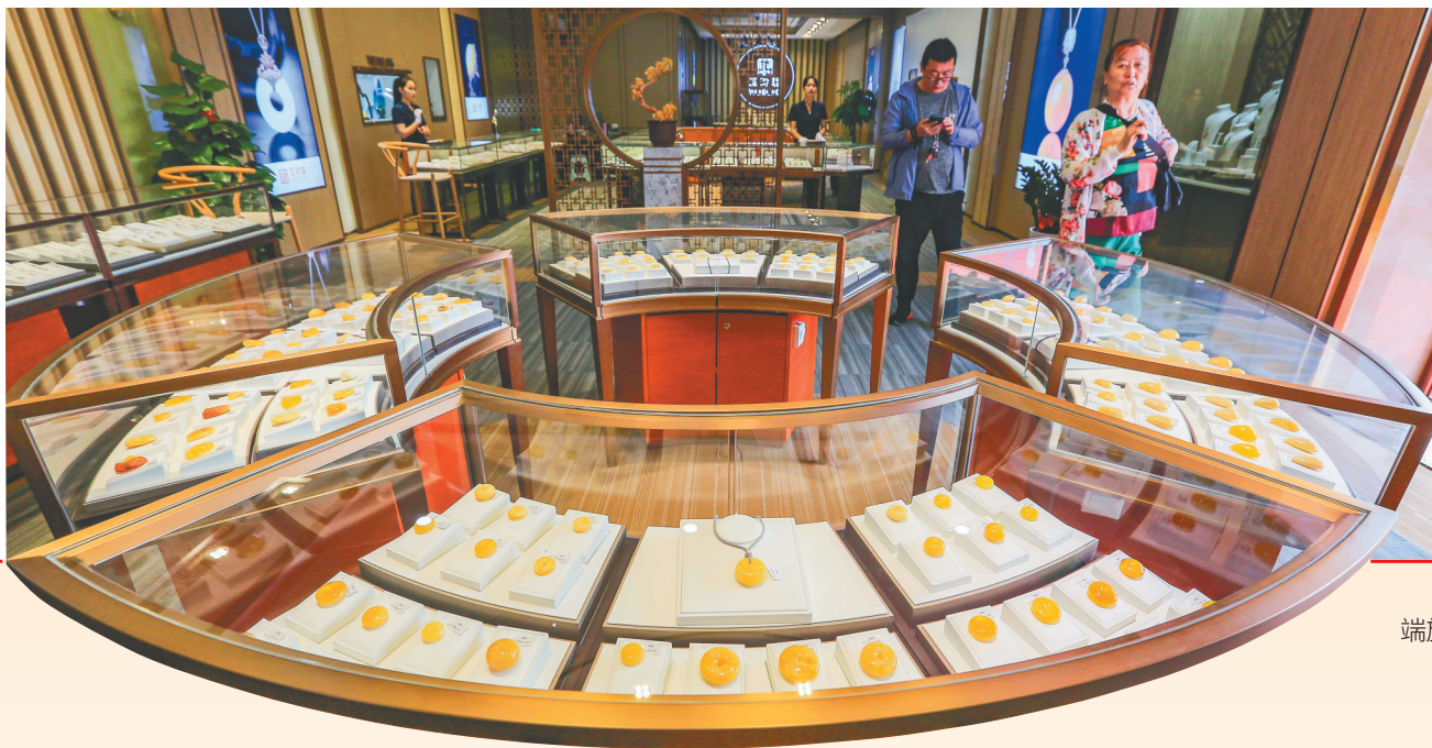
在位于洋浦保税港区的玉玲珑高端旅游消费品店，顾客在浏览商品。