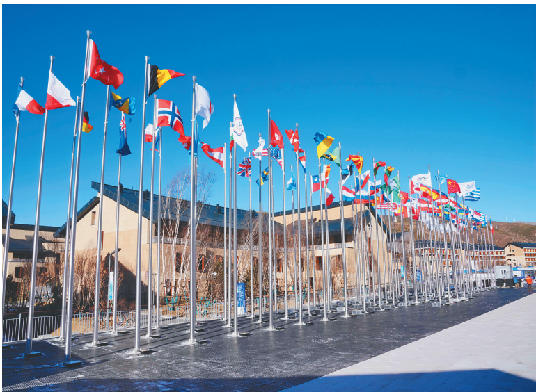
北京冬奥会张家口冬奥村（冬残奥村）。

据新华社石家庄1月13日电（记者杨帆）记者13日从北京冬奥会张家口冬奥村（冬残奥村）场馆运行团队了解到，根据场馆运行实际需求，即日起张家口冬奥村启动闭环管理，进入赛时状态。 张家口冬奥村（冬残奥村）（下称张家口冬奥村）位于张家口赛区核心区域，向南距古杨树场馆群10分钟车程，北距云顶滑雪公园12分钟车程，占地19.7公顷，总建筑面积23.9万平方米，分居住区、广场区和运行区。 据介绍，张家口冬奥村计划于1月23日预开村，1月27日正式开村，共运行53天，3月16日闭村。冬奥会期间，预计接待来自79个国家和地区代表团的2020名运动员及随队官员。冬残奥会期间，预计接待来自39个国家和地区代表团的644名运动员及随队官员。 记者了解到，1月14日—23日，张家口冬奥村将迎来部分外籍考察人员，为最大限度降低疫情传播风