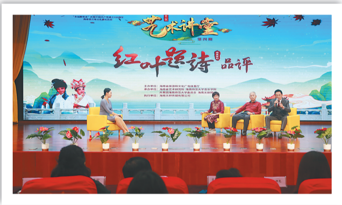
琼剧《红叶题诗》品评现场。

“打开这本书,整个世界都亮了。”周华诚是最好的导游,他低调,谦和,不张扬,不浮夸,就像那些成熟的饱满的稻谷。其文字恰如其人,质朴,内敛,不虚饰:“那样的山茶树,在山峰以上,森林当中,培育出圆润的茶籽,茶籽里蕴含着丰富多彩纯粹的山茶油。那一滴一滴的油,流动成一串串,落在衰老的光阴里,滋养着山里人家铺满皱裂的日常生活。”是不是诗意盎然,又颇接地气,读来如食新米,唇齿留香? 周