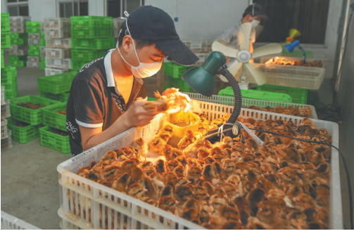
传味公司养殖基地工作人员在护理小鸡。

产业转型升级的步伐—— 根据市场需求，开发了活鸡、冷鲜品、熟制品、方便菜肴、深加工品、餐饮套餐等六大系列文昌鸡产品。目前，传味公司正在建设国内一流的食品综合加工厂，未来3年，还将分步建设文昌鸡特制风味饲料厂和文昌鸡标准化养殖园区，并通过300家终端门店开展生鲜品、熟食品批发零售业务。 海南日报记者了解到，首批4个标准化牧养农场正在前期筹备中，与此同时，分布于海口、文昌等地的7家终端门店已开张营业，营业额过好预期。未来，“传味模式”将融合一二三产，形成“特色养殖—精深加工—终端销售（餐饮服务）”的完整产业链条，实现业态互补，为乡村振兴注入持久动力。 （本报文城1月19日电）