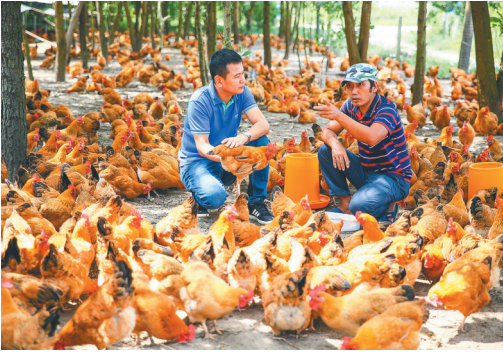
在文昌水北村，养鸡帮助村民实现脱贫致富。