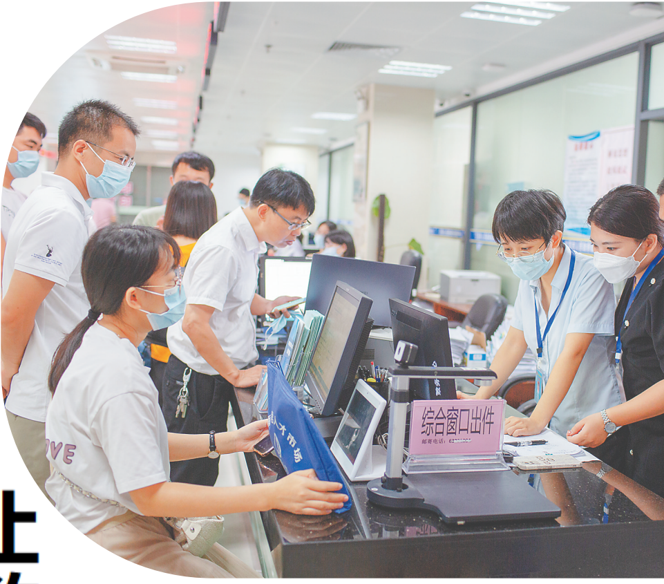
在文昌市政务服务中心，信息化系统让办事群众“少跑路”。