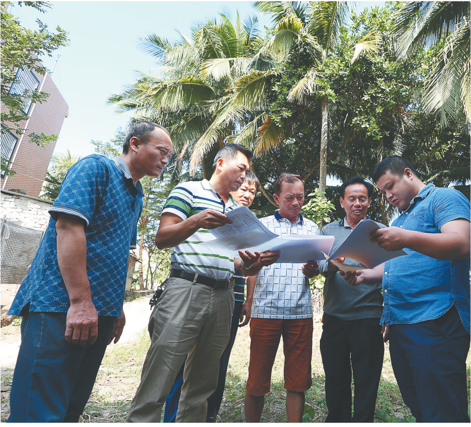
文昌政府工作人员进村为村民办理房屋报建手续。