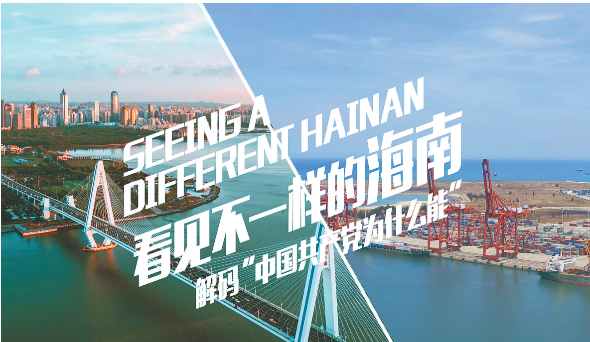
两会外传之“解码中国共产党为什么能”节目封面图。

今年海南两会期间，海南日报报业集团旗下媒体推出系列短视频，通过不同的视角，让两会话题更生动鲜活、更轻松有趣，这些精彩的短视频内容在国内外主流新媒体平台上不断刷屏，观看量和转发量不断上涨。