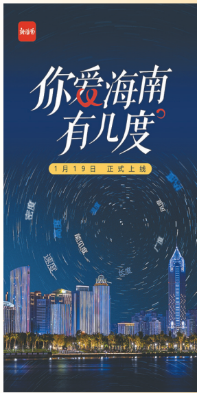
《你爱海南有几度》封面图。

据悉，该视频一经发布广受好评，被学习强国海南学习平台、中共海南省委宣传部官方视频号“海南发布”、云网网、荆楚网等多平台转载推荐，网友纷纷点赞留言，评论“拍的真好，多维度看海南之变”“大爱海南的每一度”“2022，爱海南+1度”等。