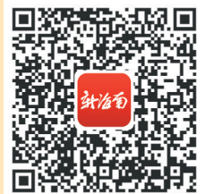
扫码观看《主播说两会》。