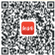
扫码观看《你爱海南有几度》。