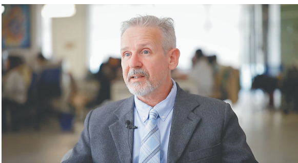
“江东之变”节目外籍主持人帕特里克·奎恩。