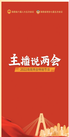
评论节目《主播说两会》海报。

本报海口1月20日讯(海报集团全媒体中心记者冉苗俊)1月20日，新海南客户端、南海网、南国都市报推出2022年海南两会视频评论节目《主播说两会》。该视频节目通过新闻主播出境评论的方式，紧密结合两会动态和网友关注话题，解读新闻、评析热点、表达观点。目前已推出第一期视频《海南进入“两会时间”，哪些热词值得关注？》，后续还将持续推出系列评论视频产品，敬请关注。