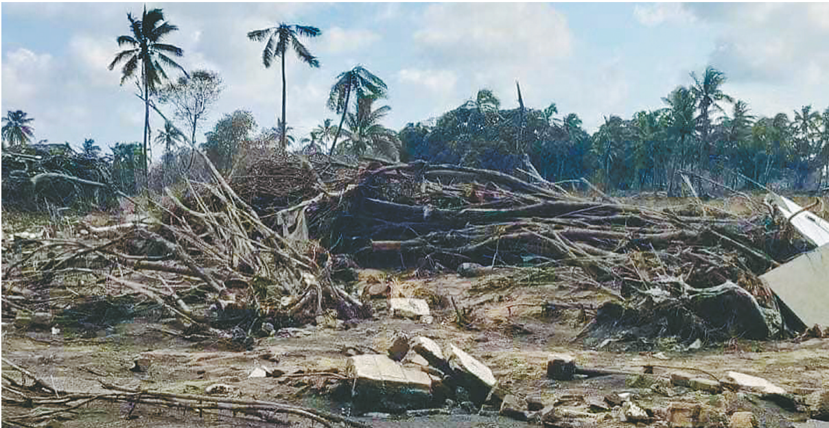
这是1月19日拍摄的海啸过后的汤加首都努库阿洛法郊外。

新华社北京1月20日电 综合新华社驻外记者报道:汤加首都努库阿洛法19日开始恢复部分供电和通信。中国政府紧急驰援,已率先向汤加提供首批应急救援物资。 中国国家主席习近平、国务院总理李克强已于19日分别向汤加国王图普六世、汤加首相索瓦莱尼致慰问电。中国政府高度关注,紧急驰援,积极向汤加提供紧急人道主义援助,以实际行动诠释人类命运共同体理念。 中国红十字会已向汤方提供10万美元紧急人道主义现汇援助。中国政府将应汤方请求援助一批饮用水、食品、个人防护用品、救灾设备等应急物资。设在广东的中国-太平洋岛国应急物资储备库已紧急启动物资调拨,包括瓶装水、肉类罐头、医疗卫生包、发电机、高压水泵、帐篷等,已做好尽快发运的准备。 中国政府通过驻汤加使馆紧急筹措了一批价值28万元人民币的饮用水、食品等应急物资,并于19日捐赠汤加政府。汤加国王图普六世表示,在汤加国家危难之际,习近平主席向我发来慰问电,中国政府第一时间伸出援手,汤政府和人民被中方义举深深感动,对此深表感谢。汤加一些岛屿受灾严重,感谢中方表示愿继续帮助汤方开展救援和灾后重建。汤副首相兼国家应急委员会主席泰伊表示,衷心感谢中国政府捐赠上述物资,这是灾害发生后汤加政府收到的首批应急救援物资,承载着汤中两国之间的特殊友好情谊。 据悉,截至目前,在汤中国公民、企业均平安,暂未接到人员伤亡的报告。汤加政府全力救灾,电力、通信、航路正逐步恢复。中国驻汤加使馆正常运转,将继续为有需要的中国公民提供领事保护服务。 据汤加媒体报道,从19日开始,汤加首都部分恢复供电,但仍时有断电,与外界联络仍十分困难。部分联络需通过海事卫星。 联合国、新西兰、澳大利亚、巴布亚新几内亚、新加坡等各方也纷纷向汤加提供援助。 联合国负责汤加事务的代理常驻协调员乔纳森·维奇20日在斐济首都苏瓦通过电子邮件接受新华社记者采访时表示,驻扎在汤加的联合国工作人员正全力以赴,积极协调援助汤加事宜。 乔纳森·维奇说,联合国将同汤加政府协商其提出的具体援助请求,汤加有望在23日前向捐赠者提出具体的援助请求。目前,汤加政府已请求国际电信联盟提供卫星宽带服务,请求新西兰及其他捐赠者提供电话服务。联合国儿童基金会21日向汤加运送消毒卫生用品包、便携油桶等援助物资。 谈到此次火山喷发给汤加造成的损失,乔纳森·维奇说,目前汤加共有8.4万人受到火山喷发及其引发的海啸影响,约占全国总人口84%。此外,约有100座房屋受损,另有约50座房屋被完全损毁,火山灰造成的影响波及汤加全境。鉴于目前评估能力有限,全部损失详情还不得而知。