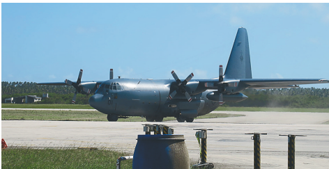
这是1月20日在汤加首都努库阿洛法的富阿阿莫图机场拍摄的运送新西兰援助物资的飞机。

据新华社苏瓦1月20日电 (记者张永兴)联合国负责汤加事务的代理常驻协调员乔纳森·维奇20日在斐济首都苏瓦通过电子邮件接受新华社记者采访时表示,驻扎在汤加的联合国工作人员正全力以赴,积极协调援助汤加事宜。 乔纳森·维奇说,联合国将同汤加政府协商其提出的具体援助请求,汤加有望在23日前向捐赠者提出具体的援助请求。目前,汤加政府已请求国际电信联盟提供卫星宽带服务,请求新西兰及其他捐赠者提供电话服务。联合国儿童基金会21日向汤加运送消毒卫生用品包、便携油桶等援助物资。 谈到此次火山喷发给汤加造成的损失,乔纳森·维奇说,目前汤加共有8.4万人受到火山喷发及其引发的海啸影响,约占全国总人口84%。此外,约有100座房屋受损,另有约50座房屋被完全损毁,火山灰造成的影响波及汤加全境。鉴于目前评估能力有限,全部损失详情还不得而知。