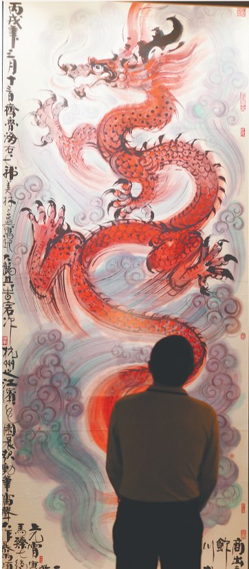
观众在海口会展工场参观韩美林生肖艺术展。