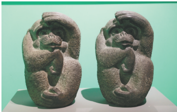
韩美林生肖艺术展上的花岗岩猴像。