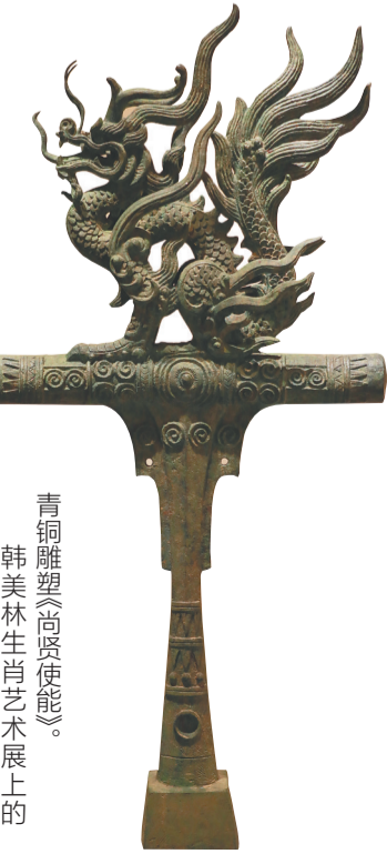
青铜雕塑《尚贤使能》。 韩美林生肖艺术展上的