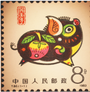
韩美林创作的第一轮十二生肖系列邮票中的《癸亥年》特种生肖邮票。

“艺术家要随时随地接地气。”韩美林认为,作为创作者,一生都应该致力于美的创造和引领,将美好与善良传达给公众,用其中蕴含的“大美”内涵打动观者,讲好中国故事。多年来,韩美林经常深入民间,俯下身来关注生活中的美好瞬间,并从中挖掘丰富题材,创造了大量的精品力作。他的作品也因而备受国内外艺术爱好者称赞,部分佳作被北京故宫博物院、中国国家博物馆、中国美术馆、俄罗斯国家博物馆、大英博物馆、埃及国家博物馆等收藏。同时,韩美林被联合国教科文组织授予“和平艺术家”,成为中国美术界获此殊荣的第一人。