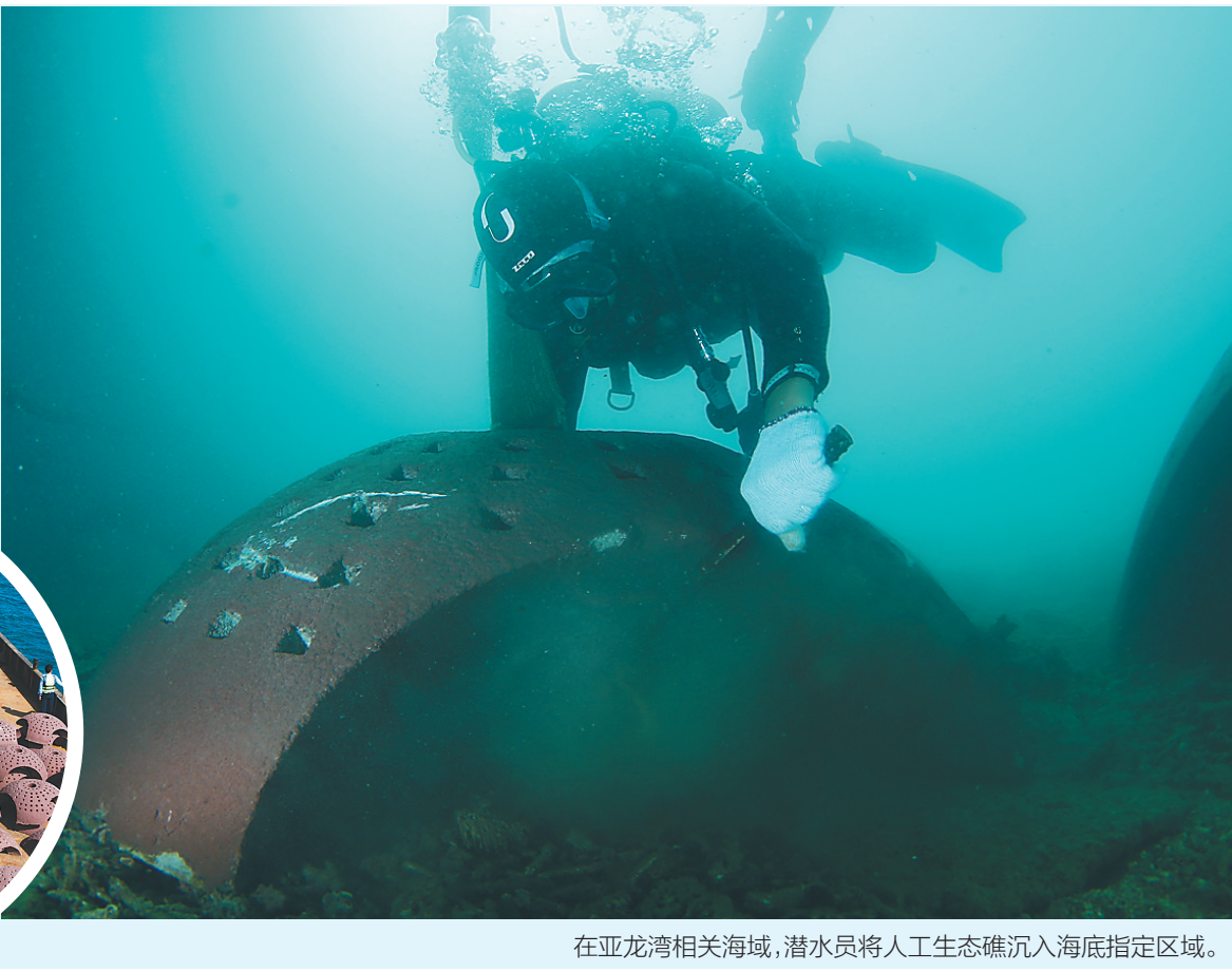
在亚龙湾相关海域,潜水员将人工生态礁沉入海底指定区域。