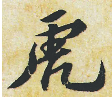
▲宋代苏軾书法作品“虎”(行书)

正是由于这种复杂的情感,中国人爱画虎,而不同时代、不同画家笔下的虎又蕴含着丰富的意义,放眼世界,中国人的虎画可以说是别具一格。早在原始社会时期,中国就出现了最早的虎画,而随着水墨丹青的发展,很多画家以虎入画,挥洒着自己的个性。