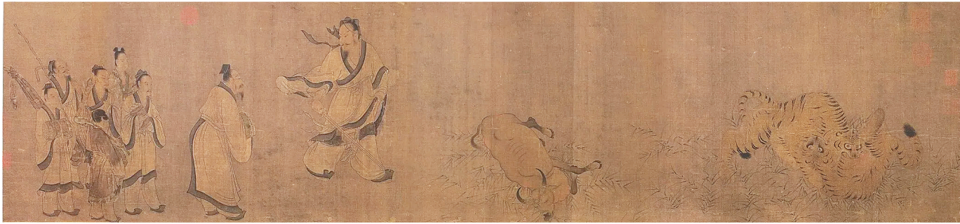
《下庄子刺虎图》(局部)

章太炎 1869 年出生于浙江余杭,原名学乘,后易名为炳麟,世人常称其为“太炎先生”。章太炎一生个性十足,不管在做学问还是在为人处事方面,都有些桀骜不驯。比如,他从来不说普通话,与人交往时,一口“重口音”的地道浙江方言,经常让对方听得如堕云雾。