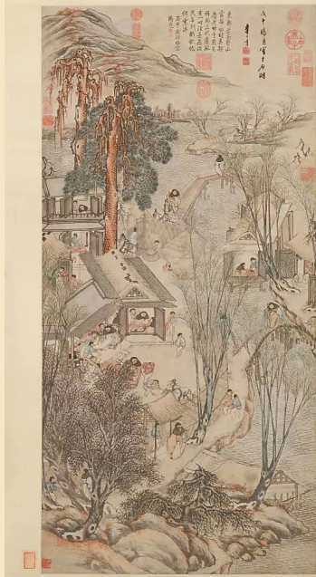
明 李士达《岁朝村庆图》