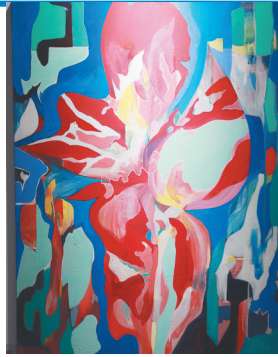
英国AI互动影像作品展“五季”中的绘画作品。

1月22日,2022 海南岛春季国际艺术展系列活动英国AI互动影像作品展“五季”在海口会展工场开展,为参观者带来艺术与科技兼具的精彩体验。