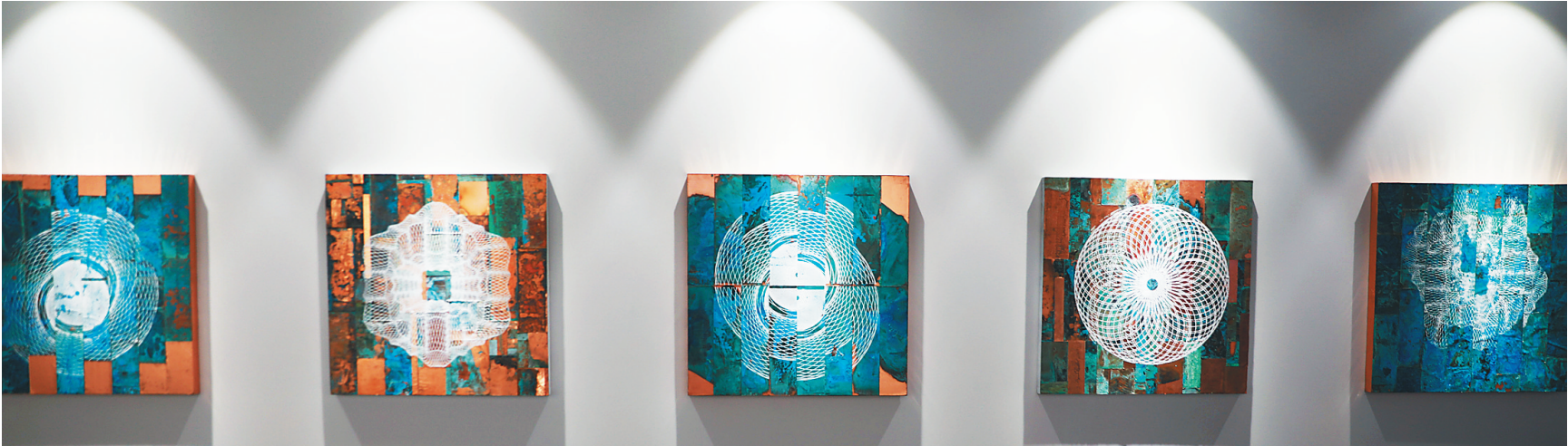
英国AI互动影像作品《五季》。