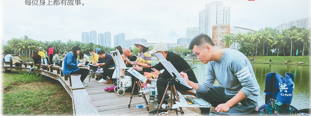
海口滨海公园写生现场。