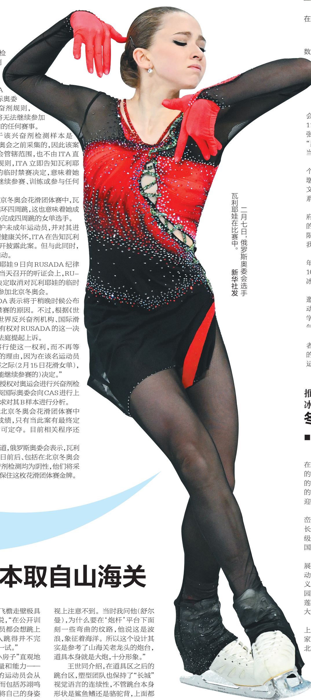
二月七日,俄罗斯奥委会选手瓦利耶娃在比赛中。

据今日俄罗斯报道,俄罗斯奥委会表示,瓦利耶娃在去年12月25日前后,包括在北京冬奥会期间接受的多次兴奋剂检测均为阴性,他们将采取一切可能的措施来保住这枚花滑团体赛金牌。