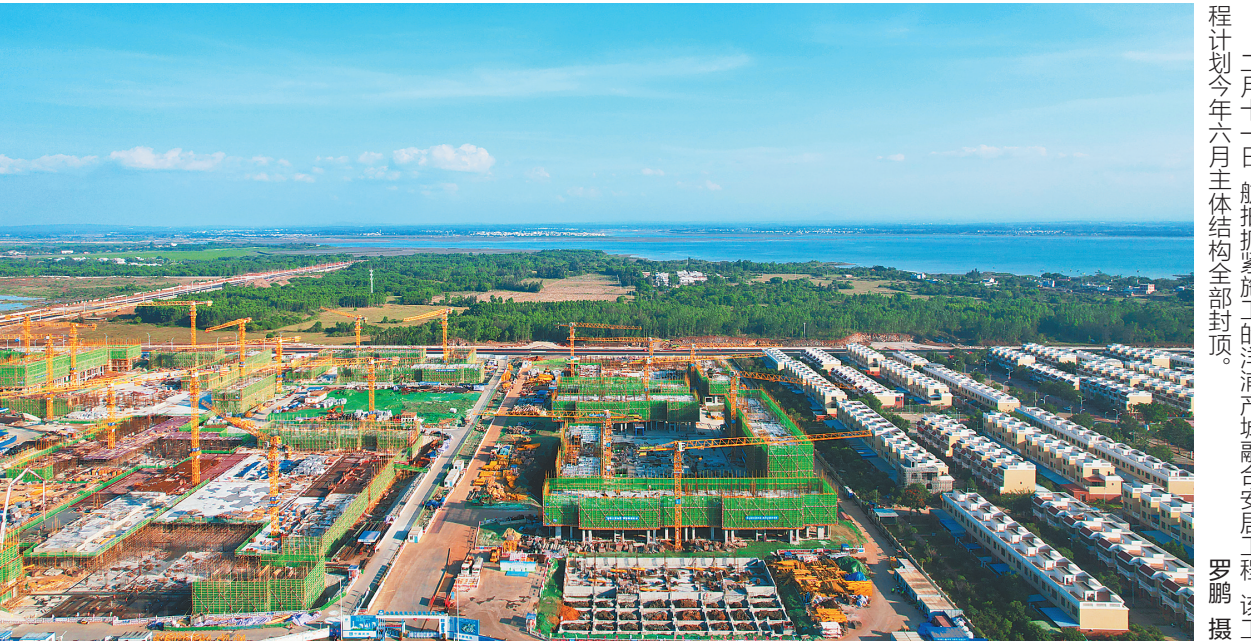
二月十一日,航拍抓紧施工的洋浦产城融合安居工程,该工程计划今年六月主体结构全部封顶。

■ 本报记者 林书喜 特约记者 李灵军 2月11日下午,儋州市政府(洋浦管委会)召开专题会,就儋州洋浦工业园区实施“一套政策”,即就目前已在洋浦先行先试的自贸港政策适用于儋州工业园木棠片区和王五片区进行研究。 在此之前的2月8日晚,儋州(洋浦)召开招商引资和项目建设工作汇报会,动员全市上下进一步统一思想、凝聚共识,认真做好招商引资和项目建设工作,加快理念创新、机制创新、方法创新,狠抓招商引资和项目建设,以实实在在的成效开创儋州洋浦一体化高质量发展新局面。 先后召开两场会议,是以实际行动贯彻落实省委关于加快推进儋州洋浦一体化发展的战略部署,标志着儋州洋浦两地加快了一体化发展的步伐。今年,儋州洋浦将重点围绕石化新材料产业园区二期、国际健康食品港、洋浦保税港区、智能制造产业园、儋州工业园王五和木棠片区等进行联合招商引资,推动项目落地建设。 “目前‘中国洋浦港’船舶港、加工增值‘免关税’、‘一负三正’‘零关税’清单等多项自贸港政策在洋浦落地后,取得了良好成效,如果这些政策可以在儋州工业园区适用,不仅将加快推动儋州工业园区建设,儋州洋浦一体化发展也将装上‘加速器’。”儋州市委(洋浦工委)相关负责人说, 下转 A02 版▶