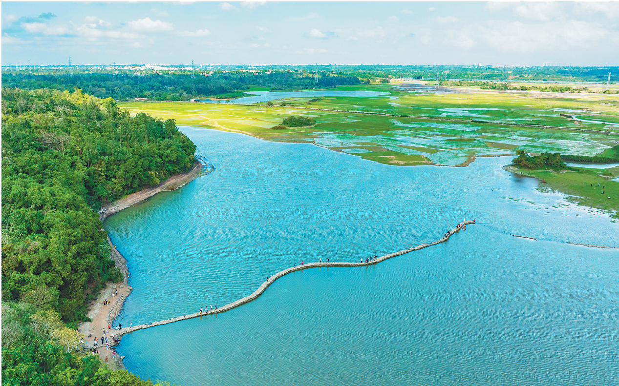
2月12日,海口市龙塘镇国仓村南面的石桥浮出水面,游客纷纷走上石桥,欣赏初春美景。石桥用火山岩修建,连接着田洋,由于形状蜿蜒曲折,当地人称之为“蛇桥”。

本报海口2月12日讯(记者昂颖)2月12日上午,2022年第2期海南自贸港大讲堂在海口举行,中国上市公司协会会长、中国企业改革与发展研究会会长宋志平应邀作专题讲座。省委书记沈晓明、省长冯飞、省政协主席毛万春等现职省级领导参加学习。 讲座中,宋志平以《国企改革实践与思考》为题,从改革的实践、国企改革的重点工作、国企的发展等三个方面,围绕国有企业改革发展,分享了他40年来国有企业管理和改革实践经验,深入阐明了当前和今后一个时期国有企业改革发展的总体方向。宋志平认为,国企改革要做好三件事,即体制改革、制度改革、机制改革。这三个维度要依次递进,环环相扣;要在做强做大主业、战略性重组和专业化整合、提质增效等方面下大力气,坚持党的领导,完善激励机制,不断将国企改革推向深入。 与会人员认为,讲座站位高、视野广,既有宏观分析、理论研究,又有具体案例、现实思考,对于充分用好海南自贸港政策优势,进一步科学谋划“十四五”海南国资国企改革,推动海南国资国企在自贸港建设中做强做优做大,具有重要指导作用。 本场大讲堂以视频会议形式进行,主会场设在省委党校新校区,各市县、省属国有企业、部分省直单位通过设分会场方式参加学习。