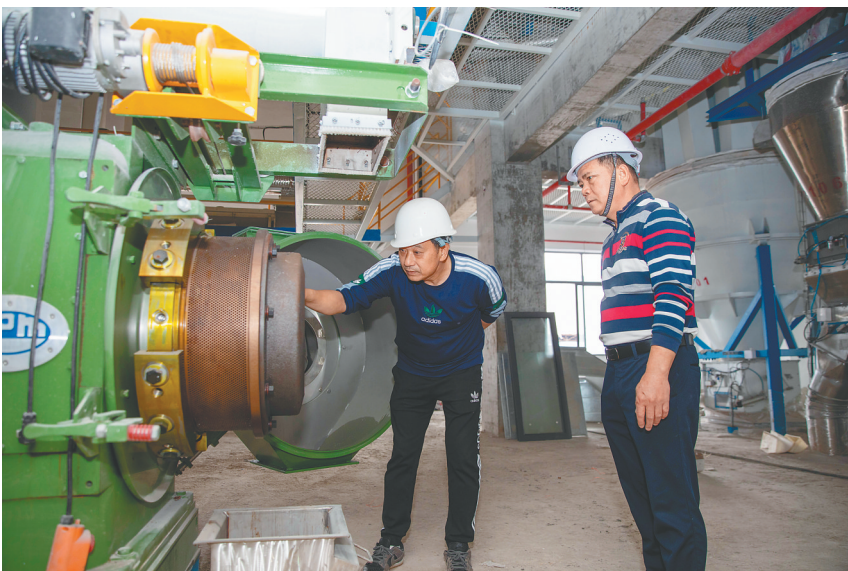
2月13日，在屯昌天之虹饲料加工厂项目的生产车间内，工作人员查看制粒机运行情况。

2月13日，位于屯昌县产城融合示范区域内的屯昌天之虹饲料加工厂项目施工现场，建筑面积超1000平方米的主厂房已拔地而起，与8个约两层楼高的大型钢结构粮仓、办公楼、员工宿舍等配套建筑与设备设施比肩矗立，穿梭其间的工人们正忙着进行收尾阶段各项工作。 “眼下项目施工进度已完成逾90%，预计今年5月即可竣工试投产。”海南天之虹生物科技有限公司负责人邓磊介绍，该项目投产后，将对接中国工程院院士、中国农业大学教授李德发技术团队的前沿技术，年产畜禽无抗饲料36万吨，可有效解决黑猪产业化生物饲料供应问题和猪肉的药物残留问题。 事实上，饲料加工厂只是天之虹公司在屯昌黑猪“大棋盘”上的一枚落子。距离饲料加工厂约3公里外，随着屯昌有关职能部门全面加快建设污水管网“最后一公里”，由该公司投资建设屯昌黑猪屠宰和食品加工等项目的前期准备工作也已进入尾声。“按目前的市场价来算，一头屯昌黑猪生猪可以卖2800元。”邓磊给海南日报记者算了一笔账，如果经过屠宰、加工与包装，一头屯昌黑猪的“身价”可涨至6000元。 发现这一“钱景”的，不止天之虹公司一家。 “以屯昌黑猪这一特色畜牧品牌为依托，我们还引进了罗牛山、海南农垦畜