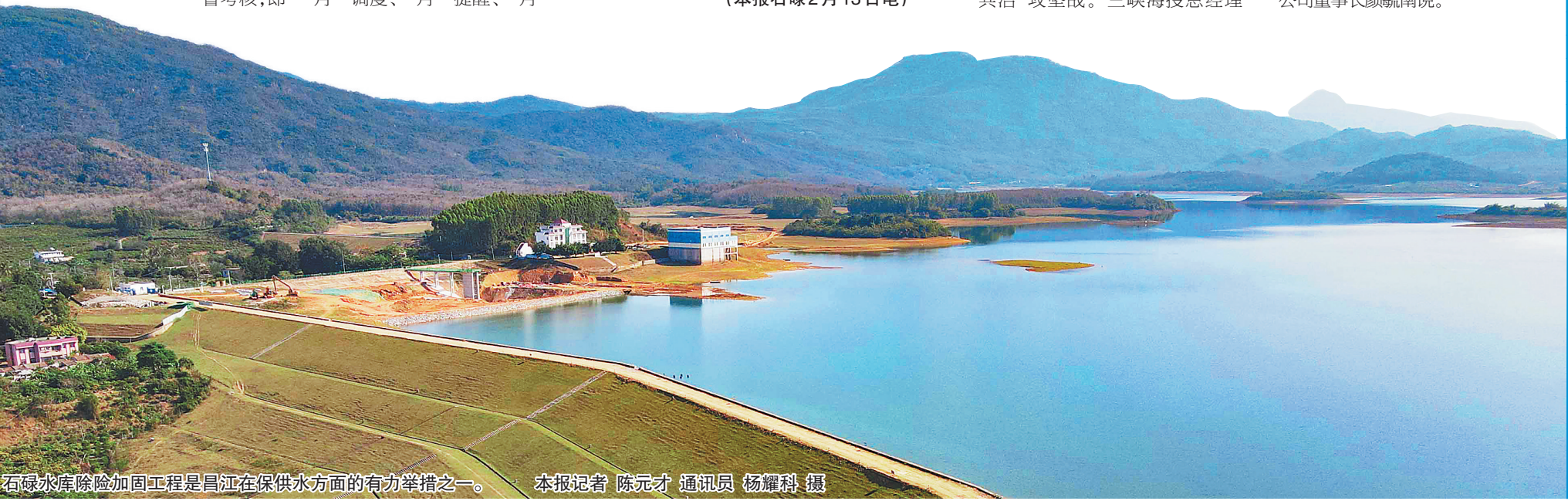
石碌水库除险加固工程是昌江在保供水方面的有力举措之一。

本报石碌2月13日电(记者刘婧姝 特约记者黄兆雪)为更好围绕创建全国文明城市开展工作，统筹推进全国文明城市创建、社会文明大行动、农村人居环境整治提升行动和巩固国家卫生县城(乡镇)等工作提级进位，2月10日下午，昌江黎族自治县创建全国文明城市工作指挥部正式揭牌成立，标志着昌江新一轮全国文明城市创建攻坚战正式打响。 据了解，2017年，昌江全面开展文明城市创建工作，经过多年不懈努力，近年来连续摘获“全国未成年人思想道德建设工作先进城市”“全国新时代文明实践中心试点县”“国家卫生县城”等“国”字号荣誉。 创建全国文明城市工作指挥部成立后，县委、县政府将抽调精兵强将，充实加强该县创文工作指挥部力量，对全国文明城市创建工作进行统筹协调和指挥调度。 昌江有关负责人表示，牢固树立“一盘棋”思想，协同作战、合力攻坚，努力推动市民文明素养不断提高、社会文明风尚不断进步、城乡环境面貌不断改善、社会公共秩序不断优化，确保每一项工作、每一个环节都权责明晰、责任到位。同时，营造浓厚创文氛围，充分调动广大群众积极性、主动性、创造性，引导群众发挥“主人翁”精神，共同参与创文，共享创文成果。