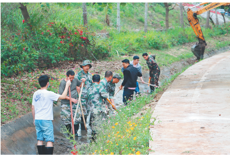
2月10日下午，叉河镇联合昌江水务服务中心在叉河镇排岸村水渠开展“六水共治”专项行动，清理渠道淤泥、垃圾等，畅灌溉、保春耕。

一督导、一月一通报、一月一考评、一年一考核”，设立表彰奖项，激励优秀单位和人员，年度考核结果作为对各单位、乡镇党委、政府领导班子和领导干部综合评价重要依据。 “我们从各成员单位抽调人员常驻办公，主要职责是承担全县治水工作的顶层设计、统筹协调、监督考核、宣传引导、信息报送等任务。”昌江水务服务中心副主任沈艺超说，县治水办的成立，改变了以往“九龙治水”的局面，下一步，县治水办将明确治水目标，排出五年行动计划，将任务进行分解，挂图作战，扎实开展“六水共治”工作。 昌江黎族自治县委书记、县治水工作领导小组组长陈儒茂表示，全县领导干部将继续拿出过去打硬战的决心、斗志，再接再厉、“真抓实干、比学赶超，切实把“六水共治”的“主战场”变成检验干部能力和实绩的“大考场”，开足马力、只争朝夕，全力打赢“六水共治”攻坚战、主动战、持久战，为昌江快步走上绿色可持续高质量发展之路、为海南自贸港建设作出新的更大贡献。 (本报石碌2月13日电)