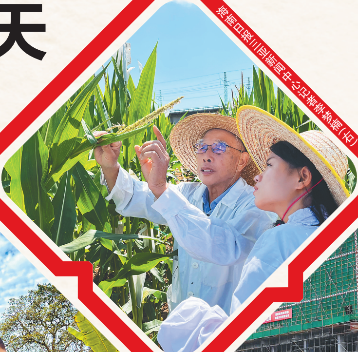
将隆口黎中台民福(中)。