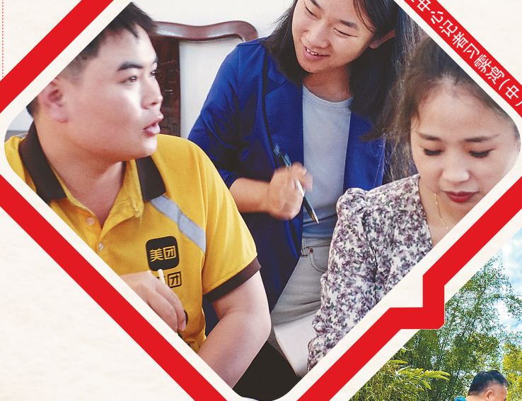
将隆口黎中台民福(中)。

一代人有代人的使命。亲眼见证这些建设者的故事,让我更清晰地感受到他们勇立时代潮头的激情,感受到他们与时代同频共振的豪情。建设海南自贸港,人人都是主人翁,我们要勇当弄潮儿,不惧风雨,不负重托,在自贸港建设一线成就自我。