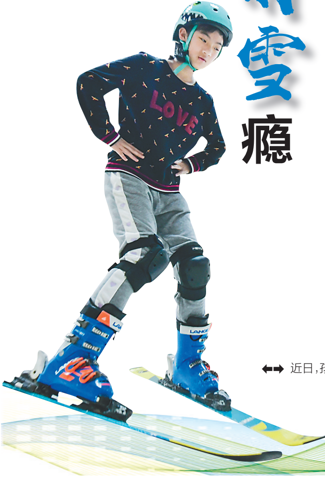
近日，孩子们在雪乐山室内滑雪馆（海口店）学习滑雪技术。

协委员下高强曾提出“关于推广冰雪运动进校园”的建议。下高强建议海南中小学校让学生充分了解开展冰雪运动的重要意义，教育行政部门要将冰雪知识普及纳入中小学校体育课程，进行冰雪运动基本常识教育；有序组织学生开展冰雪运动特色项目；积极建立政府主导、社会资源并进的合作关系。冰雪运动受气候、地理、器材、装备、食宿等条件限制较多。因此，中小学校在开展冰雪运动课程时，一方面可通过政府投入在校园建设室内专业冰场或仿真冰场，也可引入社会资源建立合作关系，构建冰雪产业体系，让中小学生喜欢去、消费得起、待得住、学得好；另一方面，建议通过政府购买服务的方式建设一整套标准的场地、教学、科研、运营体系，促进冰雪运动推广。