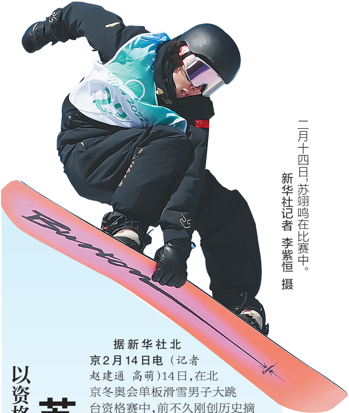
一月十四日，苏翊鸣在比赛中。