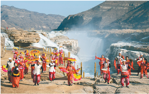
2月15日,民俗艺人在陕西壶口瀑布景区进行民俗表演。 随着元宵节到来,各地举行丰富多彩的活动,热闹闹闹闹闹闹。

土地使用税。 会议强调,要精准做好常态化疫情防控,面对国内外复杂严峻形势高度重视解决经济运行中的掣肘问题,稳定市场预期。继续做好大宗商品保供稳价工作,缓解下游企业成本上升压力,保持物价基本稳定。保障粮食和能源安全,确保全年粮食丰收,增加煤炭供应,支持煤电企业多出力出满力,保障正常生产和民生用电。政策发力适当靠前,做好进一步助企纾困政策准备,加强协调配合、形成合力,增强企业活力和经济发展动力。 会议还研究了其他事项。