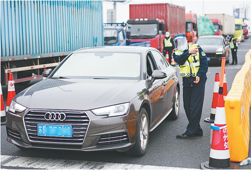
2月15日,在京沪高速公路苏州新区收费站,执法人员劝返不符合条件的车辆。 依照苏州市新冠肺炎疫情防控工作联防联控指挥部14日发布的通告,自2月15日零时起,江苏省苏州市在全市关闭15个高速公路入口,设置31个高速公路离苏查验点,驾乘人员应携带48小时内核酸检测阴性证明且健康码为绿码。