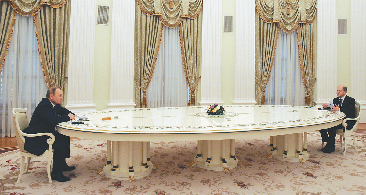
2月15日，在俄罗斯莫斯科，俄罗斯总统普京(左)与到访的德国总理朔尔茨举行会谈。

泽连斯基说：“一些使馆搬迁至乌克兰西部是个大错。这是他们的决定……乌克兰是个整体，如果发生事故，所有地方都不能幸免。”