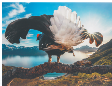
“秘境生灵——四国摄影师镜头中的野性世界”摄影展上的作品《炫耀的黑琴鸡》。