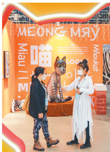
“寻喵启事”特展现场，参展嘉宾在交流。

据省工信厅初步统计，2020年之前全省涉及设计方面工作的企业有超9万家，2021年有15万余家。省工信厅产业发展处处长沈君说：“增加的趋势非常明显，这也在催促着我们要进一步围绕海南国际设计岛建设，做好相关引导、服务、支持的工作。”