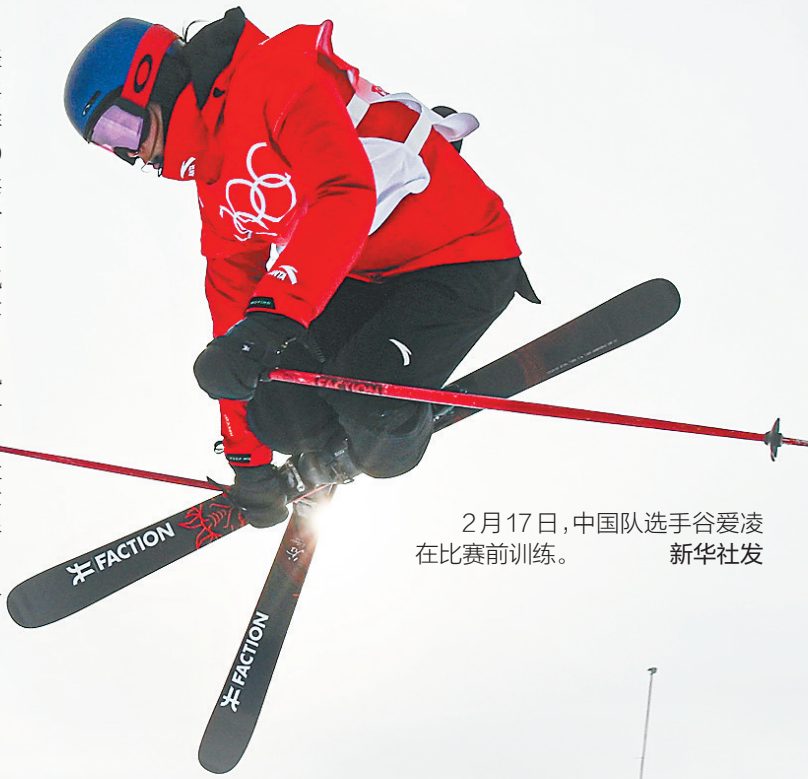
2月17日，中国队选手谷爱凌在比赛前训练。