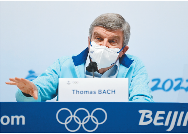
2月18日，国际奥委会主席巴赫在北京冬奥会主媒体中心出席新闻发布会。

2022年2月19日 星期六 值班主任：杨帆 主编：毕军 美编：陈海冰 校校：李彪 邱才热