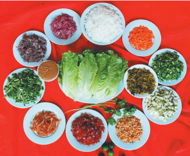
定安菜包饭。

菜包饭,在海南可以称得上是一道极富特色的美食,称之为定安的一道亮丽风景线并不为过。吃菜包饭的外地人和本地人越来越多,称道者无数,或撰文赞之,或制作美篇发布,时常见诸报章或网络,使定安菜包饭名声大振,成了一张特色美食名片,和定安黑猪排骨、定安黑猪肉粽、仙沟牛肉等定安美食齐名。